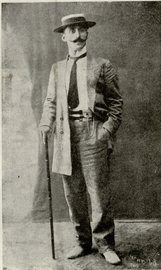
ვალ. შალვაშვილი. რეჟისორი.

— ფეფო, შენ ჩაჯექ ეტლში და წადი; ნუნუ და საშა თან წაიყვანე... მაგრამ გახსოვდეს — თუ სახლის პატრონმა გკითხოს საშას შესახებ,—უთხარი შენი შვილი არ