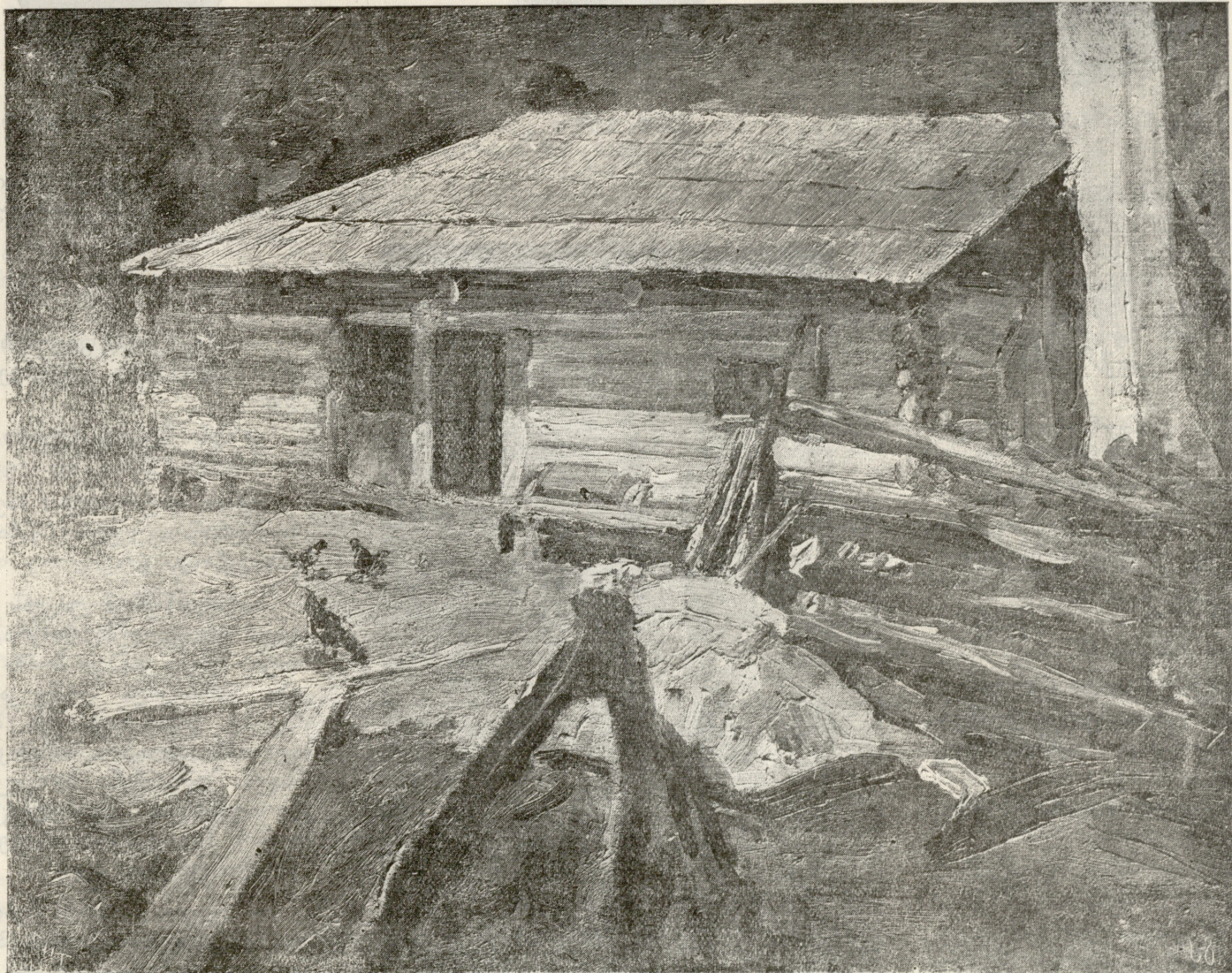
თლა, ფერადებით ნახატი ციმაკურიძისა.