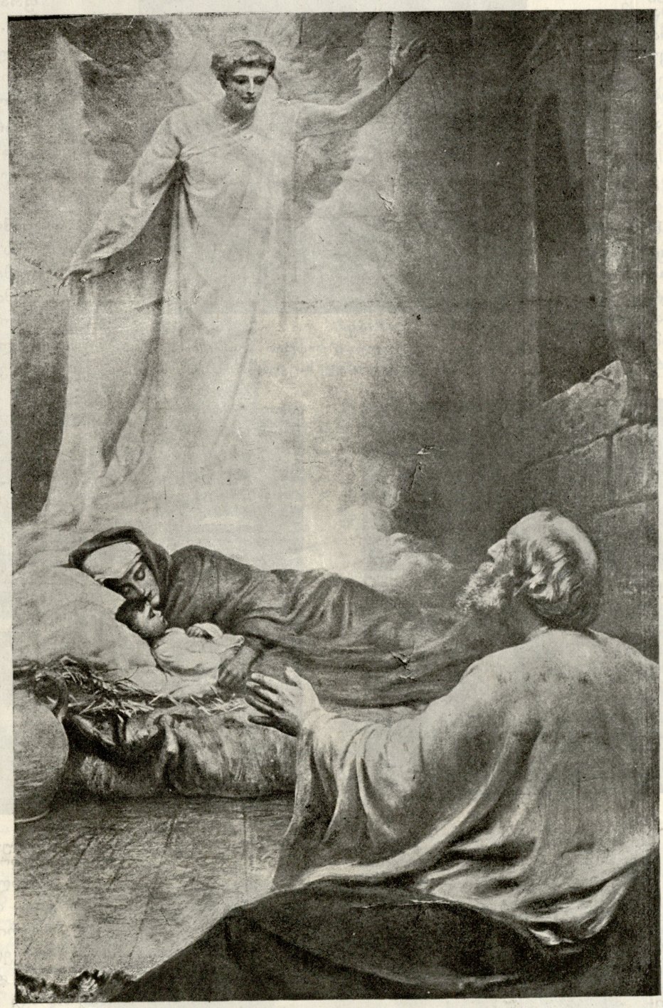
წმინდა ოჯახი. ნახტი ბრიგისა.