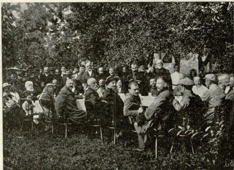
საუზმე ჭიშკრაში. (ქუთაისის განაპირას)

ფელ. (დაფანტული) ღვთის გულისათვის დაწყნარდი. დაჯექ და