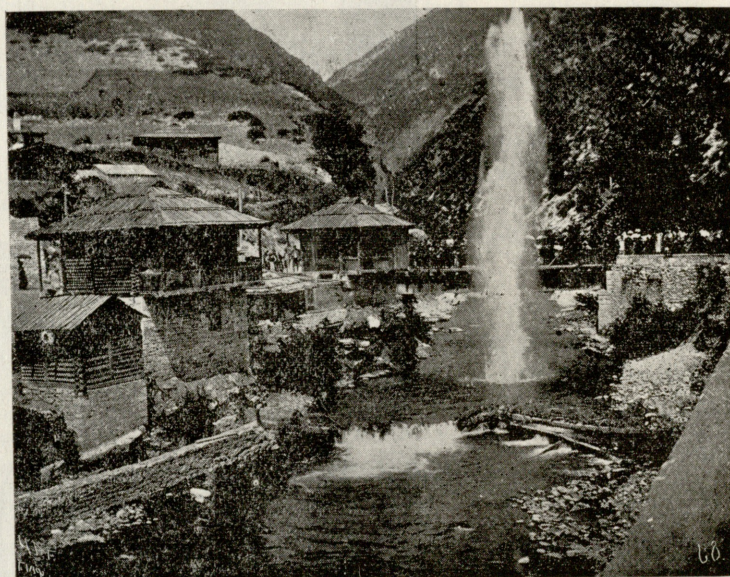
ს. ალაპანა. აქარის ხ ღთან მდინარე ლაჯანურაში ნაღმის აფეთქება სადღესასწაულო შეხვედრისას.

თი ლუკმა-პური და არც თანაგრძობის სიტყვა. შემთხვევით რომ ბერრიუს არ შევხვედროდი, იმედ გადაწყვეტილი, თავს დავიხრჩობდი.