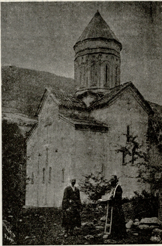
ს. წესი. ბარაკონის ეკლესია, როსტომ ერისთავის აშენებული მეთვრამეტე საუკუნეში.

ლამ. გენანები?... ძალიან მოხარული ვარ. მე მგონია ცოდვა არ იქნება დაინანო კაცი, რომელსაც ყველანი ერიდებიან როგორც ჭირიანს. შენ იცი ჩემი მდგომარეობა. ყოველის კომუნარისა ეს ნამდვილი წყევლაა. არსად სამუშაო, არც ერ-