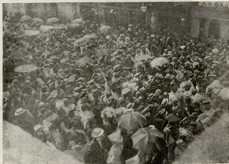
წერა-კითხვის საზოგადოების წინ

—და შენც ორთეხა ჭიავ—ადამიანო—მუდამ თავი რომ მოგაქვს შენის ცოდნითა და სილიადით, დასტკბი... მე გიამბობ მომხიბლავ ზღაპარს ზღვის ქალისას, რომელსაც მიჯნური ცხრა მთას იქითა ჰყავს გადაკარგული და რომლის ლოდინ-შიაც მუდამ ცრემლს აფრქვევს“.