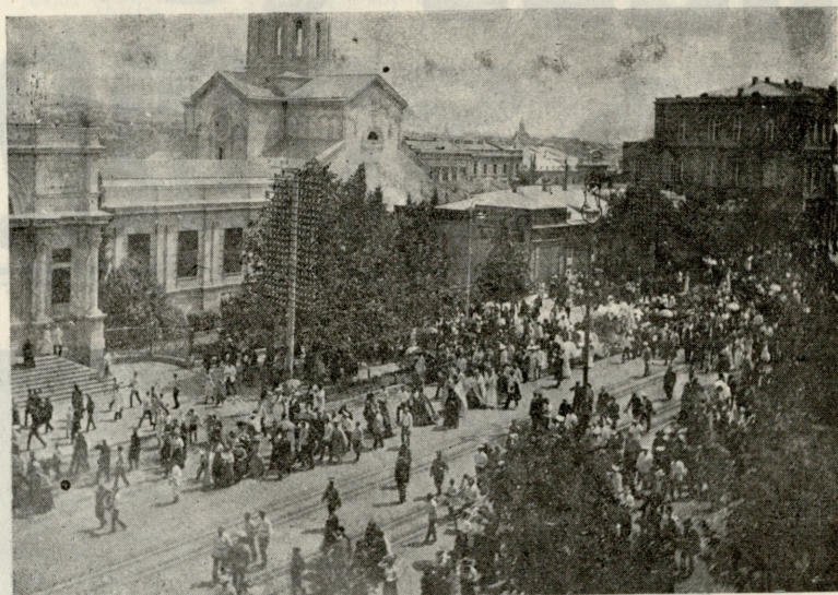
მიცვალებულს გასვენება გოლოვინისპროსპექტით.