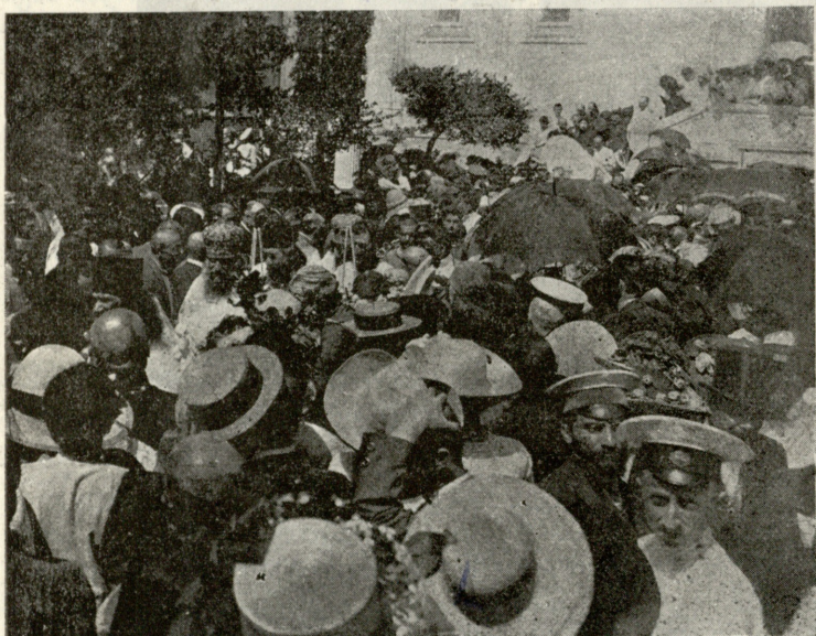
გამოსვენება ქვანეთის ეკლესიიდან.