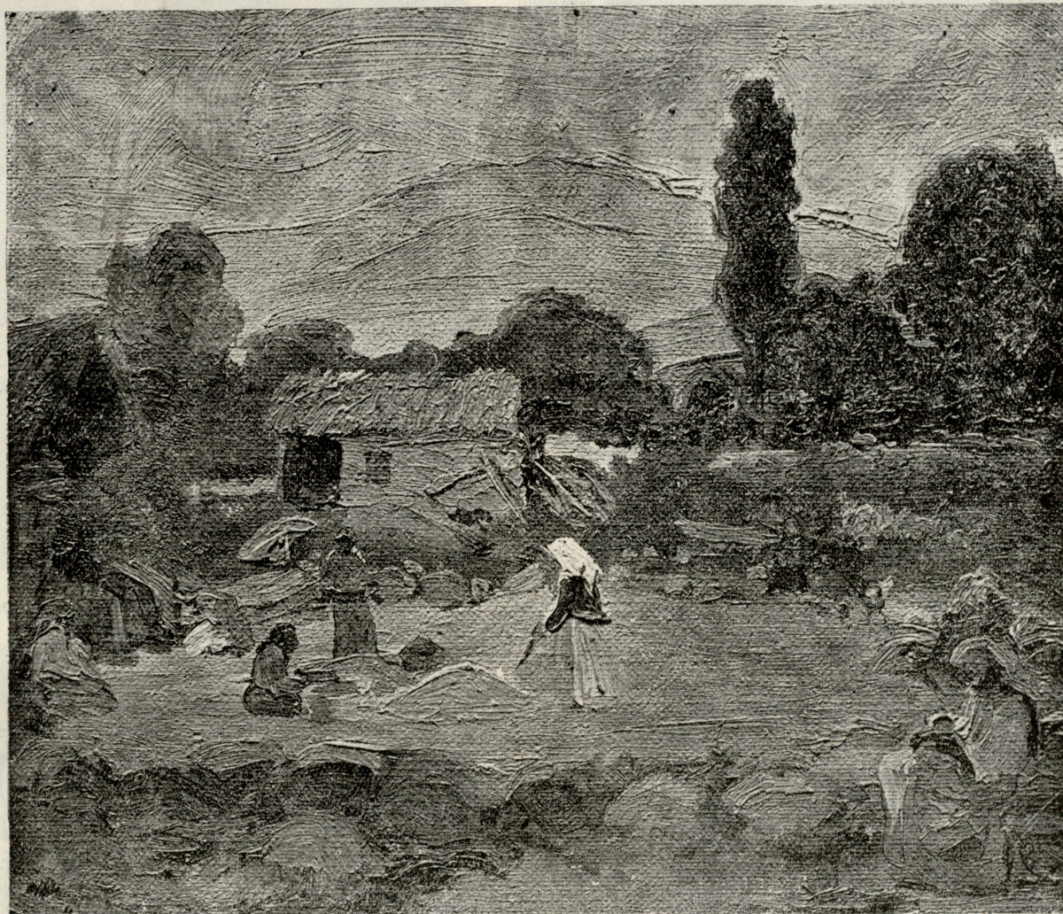
კალობა (ქართლში). ფერადებით ნ.ხატი მოსე თოიძისა.