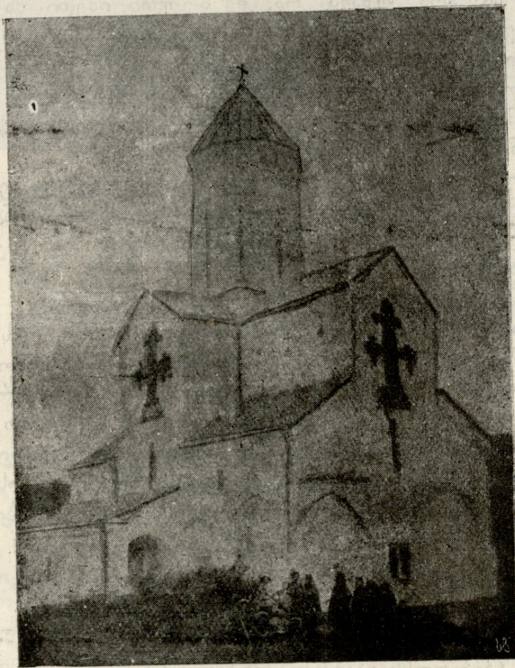
შუამთის მონასტერი და ქუთაისის ქართულ გიმნაზიის ექსკურსანტები. შუაში დგანან ამ მონასტრის ბერები.