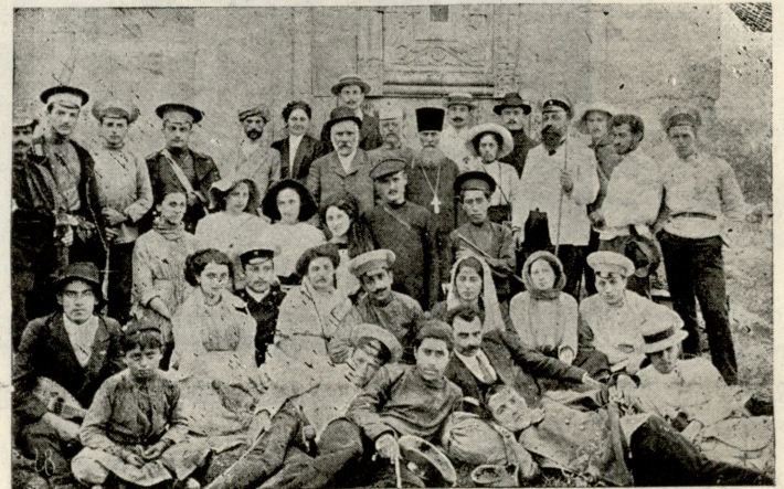
ბეთანიაში მყოფი მოგზაურნი.

მარ. ანგელოზია, ანგელოზი, ენაცვალოს მართა. ისიც რომ არა მყავდეს ნუგეშის მომცემად აქ რა გამაჩერებდა ამდენ ხანს? გულ-კეთილია, გულ-კეთილი რომა... ყველაფერი სხვისთვის და თითონ კი მუდამ ხახა გამშრალია.