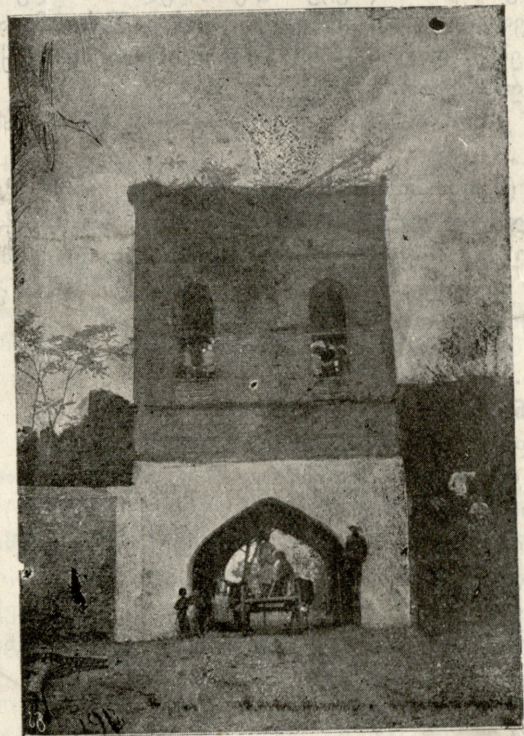
ქუთაისის ქართულ გიმნაზიის მოსწავ. ექსკურსია თელავში. ერეკლე მეორის საზაფხულო დასასვენებელი ოთახი.