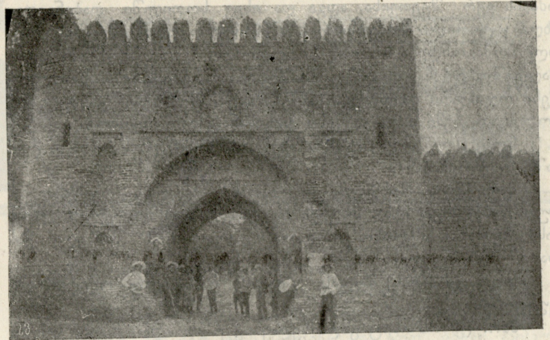
ქუთაისის ქართულ გიმნაზიის ექსკურსია თელავში. ერეკლე მეორის სასახლის ციხის მთავარი შესავალი.