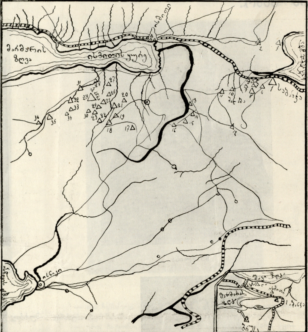
რუკა ოსმალეთის ქართველ მაჰმადიანთა სოფლებისა ისმიითს სანჯაჰში (მანჯაში) ნიშნები: — შარა ტყეში. — რკინის ბეჭეტი. ○ — სმარა სვირ-ჩიქი △ ქართული სოფლები

სულ: 2524 კომლი. კომლებზე 8 სული რომ ვიანგარიშით გამოვა 20,192 სული.