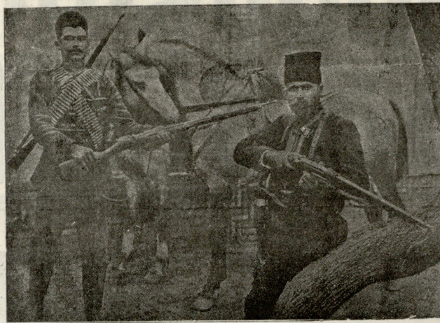
სარდალი ეფრემ-ხანი, (მარჯვნივ), კავკასიელი სომეხი, რომელიც თვალსაჩინოდ მოღვაწე იყო სპარსეთის რევოლუციაში. 5 მაისს მოჰკლეს სოფ. სურუზას, ქამადანის მახლობლად, სალარ-დოულეს ჯართან ბრძოლაში.