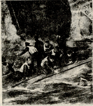
„ტიტანიკის“ კაპიტან სმიტის უკანასკნელი წუთები.