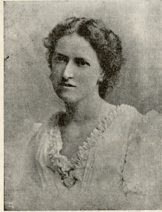
მარჯორი უორდრობი ინგლისელი მწერალი ქალი, რომელიც ინგლისურად „ვეფხისტყაოსანი“-ს თარგმნა.

ეს წერილი ილია აგლაძის მიუღია 1908 წ. ქან მარჯორი უორდრობისაგან.