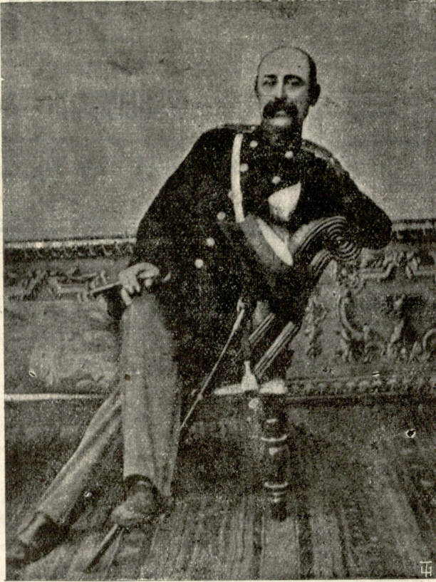
პოეტი ვახტანგ ჯამბაკურიან-ორბელიანი მის დაბადებიდან ასის წლის დღესასწაულის გამო.