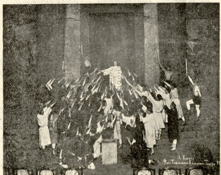
(სურათი 1), სოფოკლის „ედიპ მეფე“, ტფილ. სახაზინო თეატრში დადგმული მარჯანიშვილის რეჟისორობით.

ცხენი ფრუტუნით მისცურავდა. შუა მდინარე გადასერა გენომ. შხუილისაგან ყურთა სმენა აღარ იყო. ნაპირიდან რალაც ღრინაცელი და წივილ-კივილი ისმოდა.