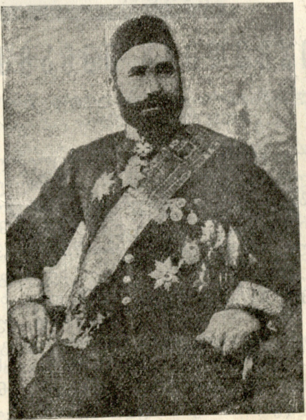
ჰაჯი ზეინალ აბდილ ტაგიევი, ბაქოელი მილიონერი.

შაქრო. (წამობტება) დაუქერიათ?... მერე რა შუაშია?..