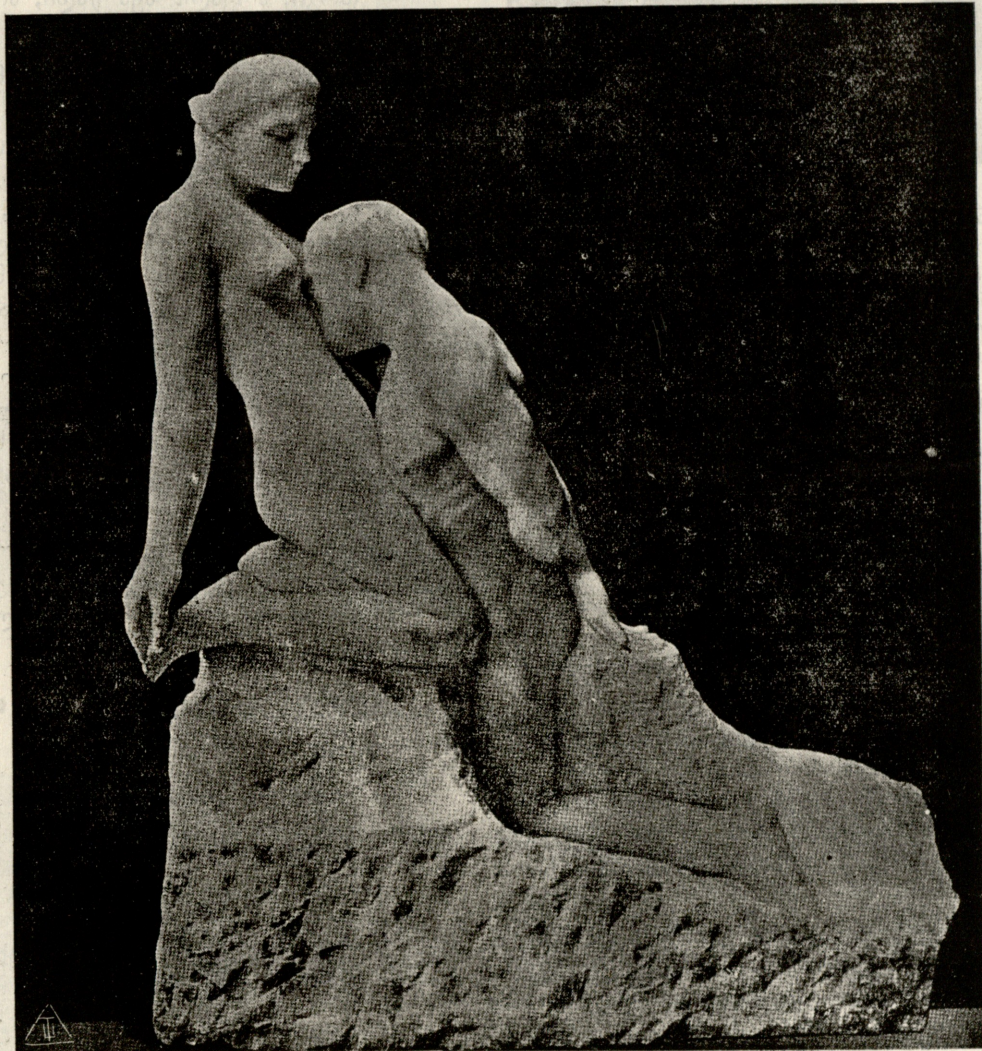
მულმივი კერპი,—მარმარილოს ქანდაკება როდენისა.