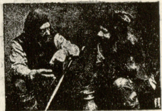
1. ჰორაციო. კ. პ. ხობლოვი. 2. ოფელია. ა. გზოვსკაია. 3. ჰამლეტი. ვ. კაჩალოვი. 4. ლაერტი. რ. ბოლესლავსკი. 5. კლავდიუსი და გერტრუდა. ნ. მასსალიტინოვი და ა. კნიპპერი. 6. აქტიორები. ა. ვიშნევსკი და პ. ჟარიკოვი. 7. როზენკრანც და გილდენსტეინი ს. ვორონოვი და ბ. სუშკევიჩი. 8. დუელი, ჰამლეტსა და ლაერტისა ვ. კაჩალოვი და რ. ბოლესლავსკი. 9. პოლონიუსი. ვ. ლუესკი. 10. აჩრდილი ჰამლეტის მამისა. ნ. ზნამენსკი. 11. მესაფლავეები ვ. გრიბუნინი და პ. პავლოვი.

ერთი რომ დაღმართს დასდგომოდა და არარაობის უფრსკულისაკენ დაშვებულებოდა, მეორე უკვე ამოსულიყო ამ არარაობის წყვილიდან და იმედ მოსილი შესდგომოდა იმ აღმართს რომელიც თანდათან ნათელს და ბედნიერებას უახლოვდებოდა მოგზაურს. ერთისა ჯერყო აღორძინებად, ხოლო მეორისა მოკლებად და დამდაბლებად.