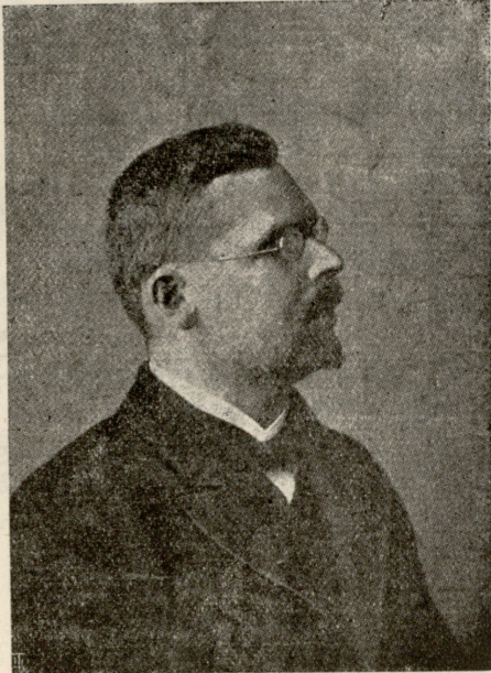
ტ. ო. ო. მ. ი. ა. ნ. ც. ი.

ცნობილი კოლხეთელი, რომელიც ამას წინაღობის წინ ჩამოვიდა, მოსკოვის სახალხო საკოლხეთო ბანკის განყოფილების დასაარსებლად.