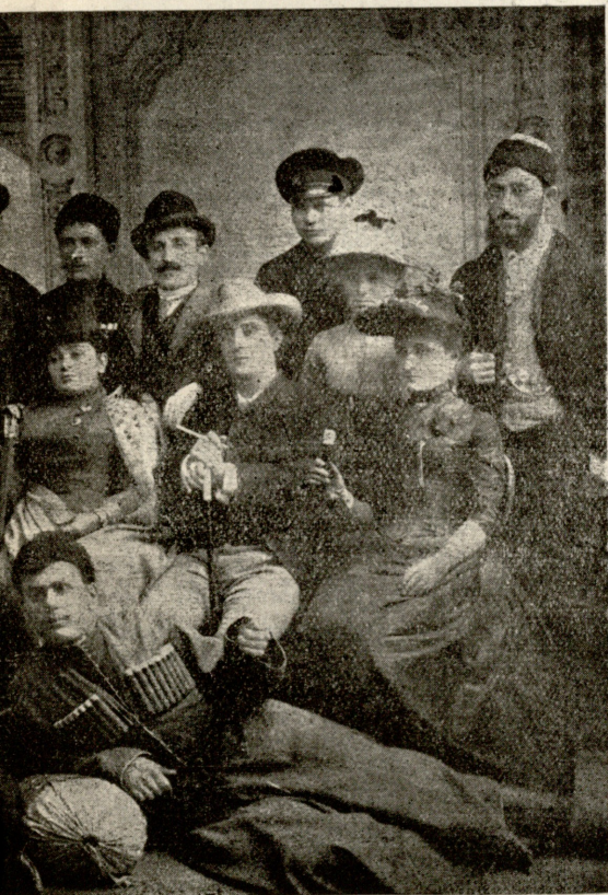
ჭა მ. შუთაისი 1899 წ.