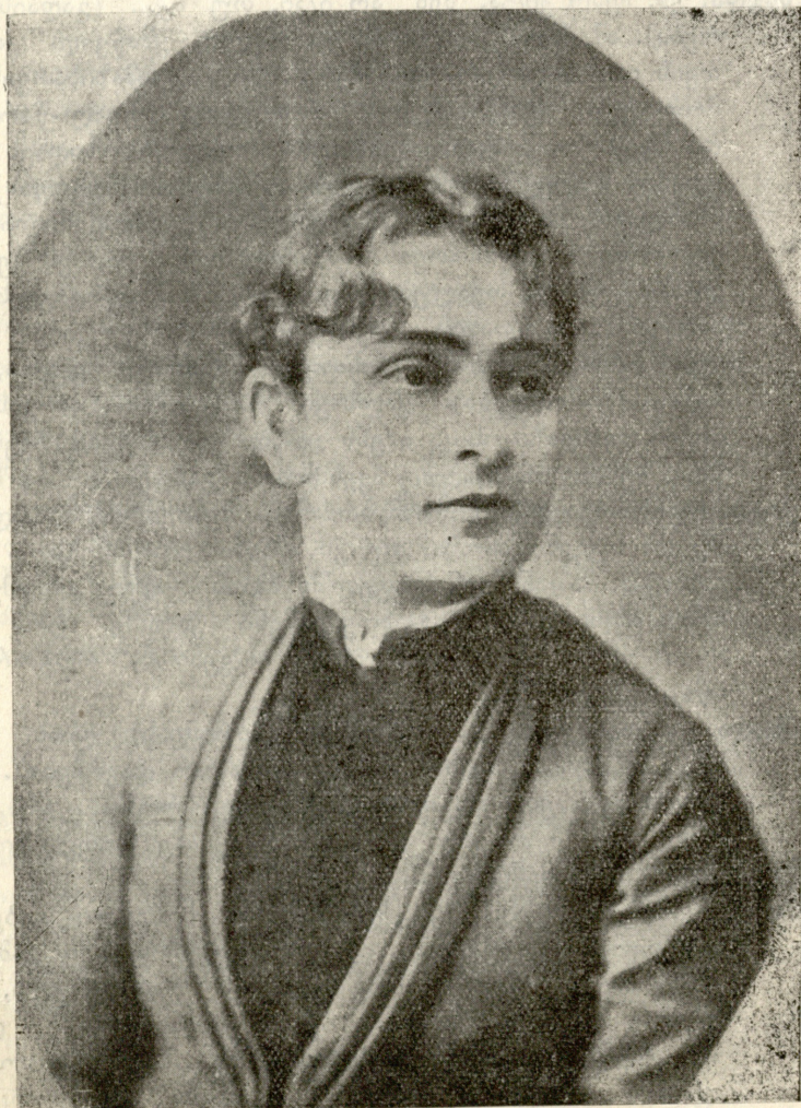
მ. საფაროვ-აბაშიძისა 1888 წ.