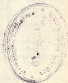
ნ უ ც ა („ალღუმია“)