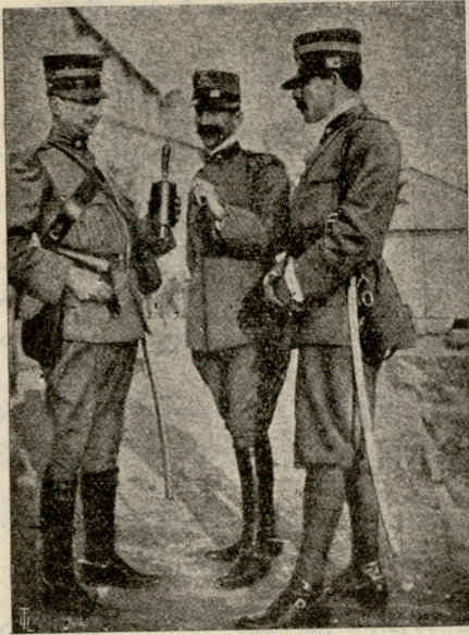
აერობლანიდან ხახრალა ყუმბარა, შუაში სდგას ყუმბარის გამომგონი კაბატანი ბანტემპელლა.

სებად გადავიქცეთ და არა იმ ტიკინებად დავრჩეთ, რომლებბად გავხდით მამაკაცთა წყალობით!!..