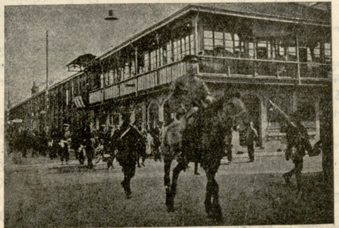
ჩვევალუციონერთა დარაჯნი ქუჩებში.