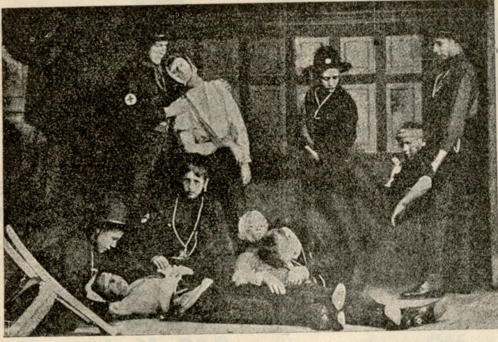
პატარა ჯარისკაცები („პოტუშნიკი“) ფინლიანდიაში. სასანიტარო სამსახური.

ზიის „ინსპექტორს“. გრიშა სასწავლებელში მიიღეს. მესამე დღეს დაახინავა მამამ ერთ შორეულ ნათესავის ოჯახში, ცოტა სახარჯოც დაუტოვა, მამაშვილური დარიგება მისცა და სახლში დაბრუნდა.