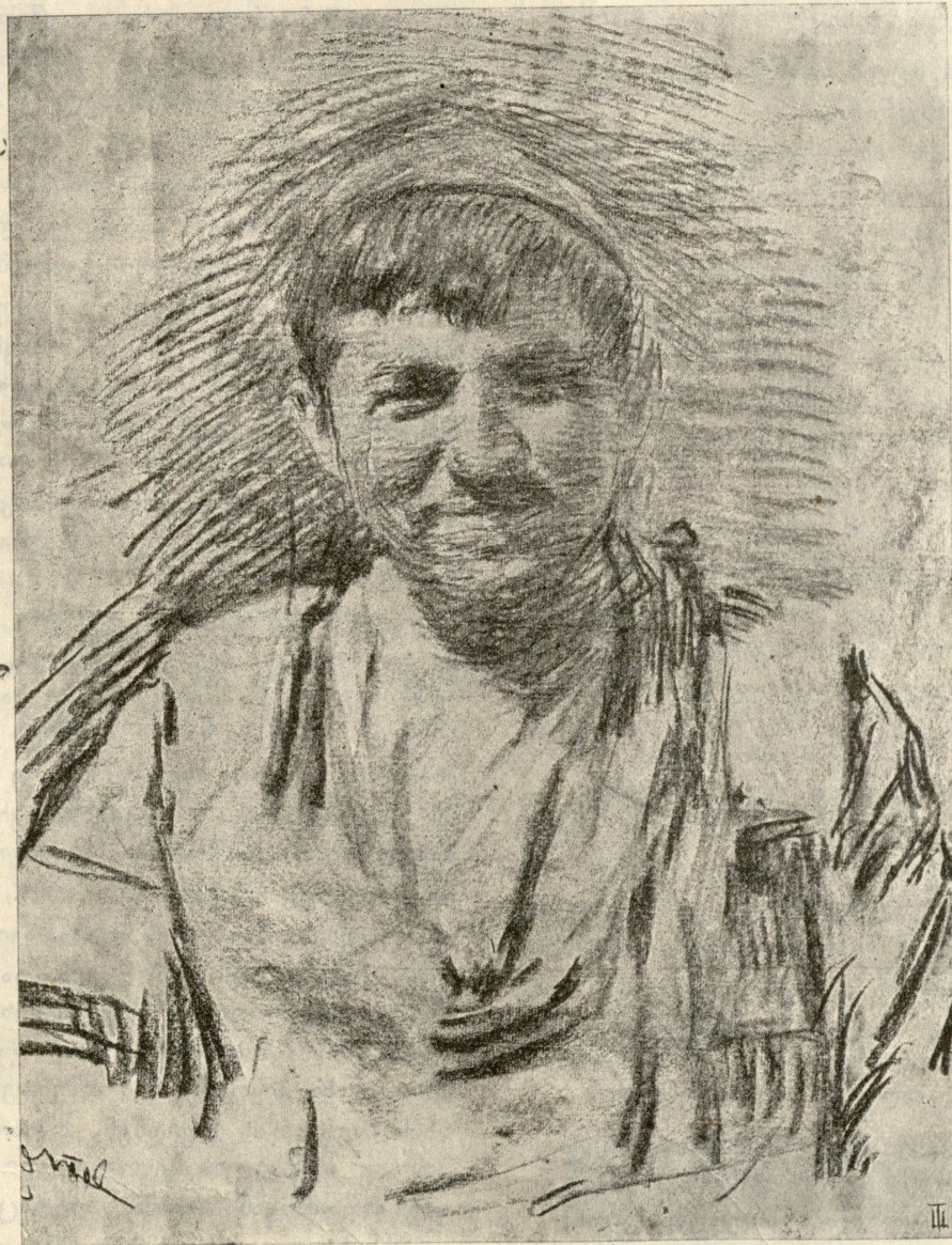
ქართული ბიჭი, ნახატი კ. ქავთარაძისა.