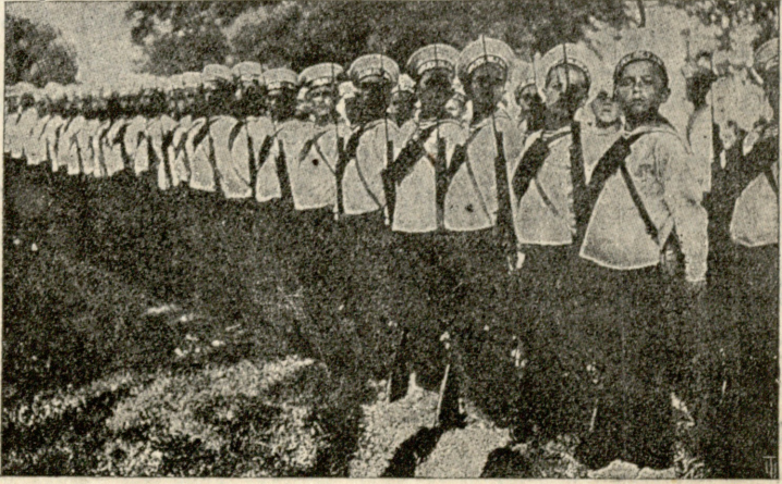
პატარა ჯარისკაცები (მეზღავურები).

რამდენი ხანი გადიოდა, სიყმაწვილე ჩელში ეცლენ-ბოდა და ხანში შედიოდა, იმდენად უფრო, უახლოვდებოდა ბუნებს, იმდენად მეტ სიმშვენეირეს ჰხედავდა მასში, რასაც წინად ვერც-კი ამჩნევდა. როცა თვით ბუნების სიმშვენეირის წარმოადგენელთაგანი იყო, არ ეჭირვებოდა სხვაგან, ბუნებაში ეძია სიმშვენეირე თვით შვენებს. დღეს, თვითეულ ღრუბლის ლამაზად გამონაკეთას ლურჯ