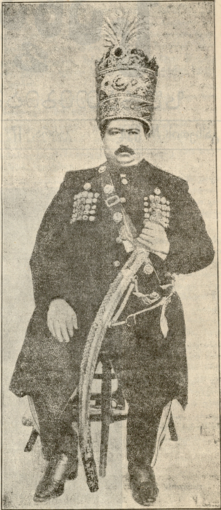
მამოხმად-ალი, გადაყენებული შაჰი, მამა ეხლანდელ შაჰისა.

პირველ დაწყებითი სწავლა მან დააწყებინა კესოს. მერე მიაბარა სოფლის მღვდელს. ახალ სწავლა დასრულებუ-