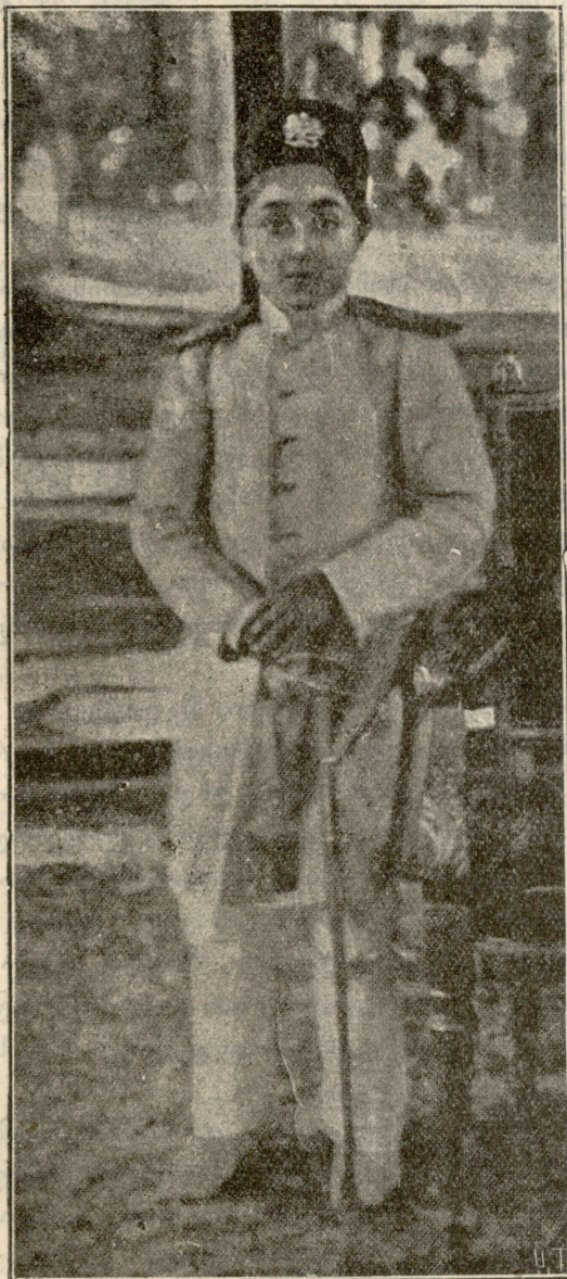
აჰმედ-მირზა, სპარსეთის შაჰი, შვილი გადაყენებულ შაჰისა.

ფიული აღწერილობით, ზეპირ გადმოცემით, საბავშვო ლიტერატურა, მებარეშუმეობის და მეფუტკრეობის ნაწილი ხელ-საქმე, აი რას სწავლობდა სოფლის ახალგაზღობის ღარიბი ნაწილი.