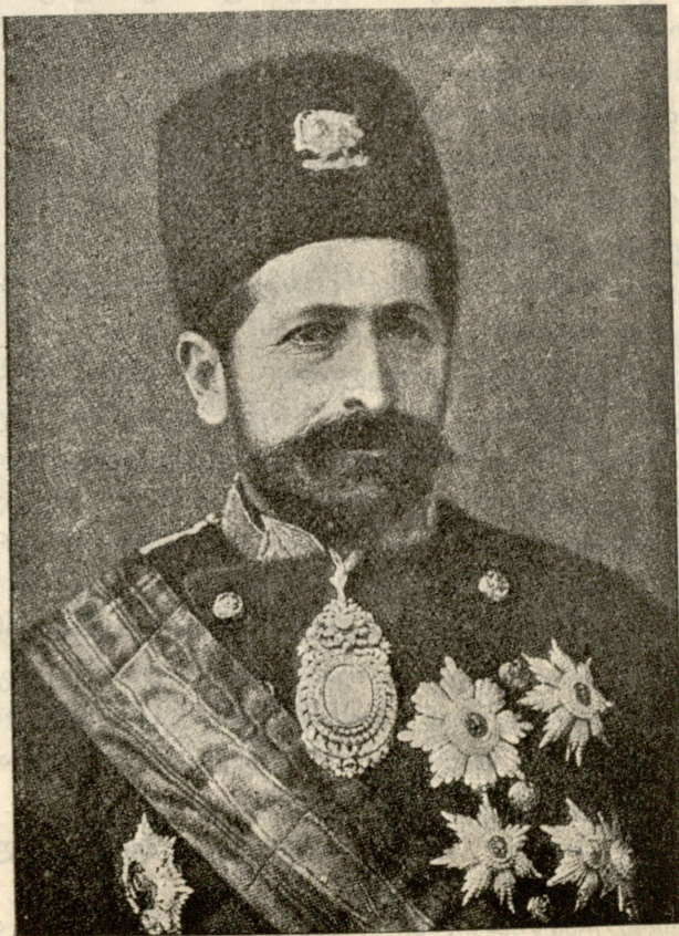
სპარსეთის მინისტრ-პრეზიდენტი ზაჰეზადარი.

— უნდა წეიყვანო,—უთხრა ცოტა დაგვიანებით. კესო ამ დროს კაბას ისწორებდა, ქარხალივით წამოწითლდა სიხარულით... იმავე წამს დარღმა მოიცვა მისი სახე, ხე-