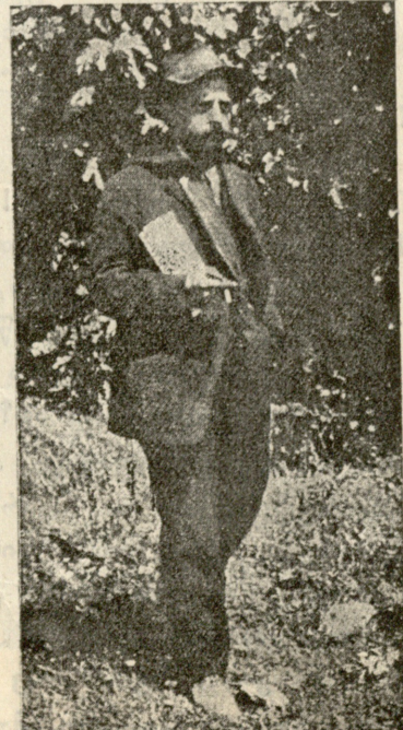
მორანსო მორანი, ალბანეთის დროებით მთავრობის მოთავე.

(კატო ალაგებს და ასუფთავებს იქაურობას. მერე მოი-ხსნის წინ-საფარ მანდილს. გაიტანს მუკრე ოთახში და ისევ ჩქარა ბრუნდება. მიუჭდება მაგიდას და სქელ რვე-