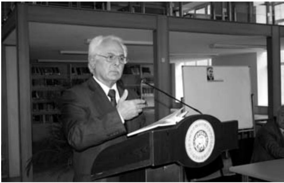
ივანე ჯავახიშვილის სახელობის თბილისის სახელმწიფო უნივერსიტეტში ცნობილი იურისტისა და მწერლის ბეჟან ხარაზიშვილის (ხორნაბუჯელი) მოსწავლეები, მეგობრები და კოლეგები შეიკრიბნენ და კიდევ ერთხელ გაიხსენეს მეცნიერის მიერ განვლილი ცხოვრება და მოღვაწეობა.