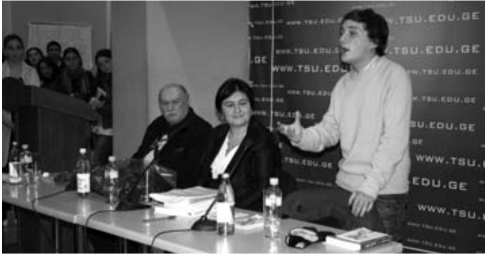
გაქვს წარსული? — გექნება აწმყო! იცი აწმყო ფასი? — გექნება მომავალი! მიხარია, რომ ჩვენს ახალგაზრდობას გააზრებული აქვს, რომ სამ დროში უნდა იცხოვროს, — მიმართა პოეტმა ჯანსუღ ჩარკვიანი სტუდენტებს თბილისის სახელმწიფო უნივერსიტეტში გამართულ პოეზიის საღამოზე „სამი თაობა“, სადაც პოეტმა ჯანსუღ ჩარკვიანი, მაცვალა გონაშვილი და ლექსო დორეული მსმენელის წინაშე საკუთარი შემოქმედებით წარსდგნენ.