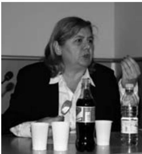
პოლიტიკური მეცნიერებების განვითარების დონე გარკვეულ კავშირშია დემოკრატიის განვითარების დონესთან. განვითარებული დემოკრატიის ქვეყნებში პოლიტიკოსები ყურადღებით აკვირდებიან პოლიტიკურ მეცნიერებებში მიმდინარე კვლევებს, რასაც პოლიტიკური საქმიანობაში ინტენსიურად იყენებენ. თავის მხრივ, პოლიტიკური მეცნიერებები იმ საკითხებს იკვლევენ, რაც ხელს უწყობს პოლიტიკური პროცესების სწორად წარმართვას და სამოქალაქო საზოგადოების ჩამოყალიბების პროცესს.