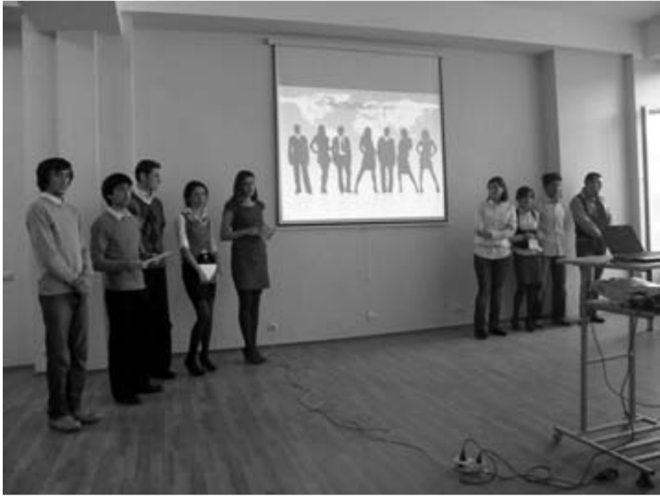
საშუალო და მცირე ბიზნესის განვითარების ხელშეწყობა, ქვეყნის სტრატეგიულ ამოცანათაგან, ერთ-ერთი პრიორიტეტული საკითხია. ამ სფეროში დაინტერესება სახელმწიფოს დასაქმების პრობლემასაც მეტ-ნაკლებად მოუხსნის. სწორედ ამიტომ არის მნიშვნელოვანი ბიზნესის სანარმოებლად სპეციალისტთა მომზადება, რომლებიც საშუალო და მცირე ბიზნესის განვითარების პროცესში თავის სიტყვას იტყვიან. ამ მიმართულებით თსუ-ის ეკონომიკისა და ბიზნესის ფაკულტეტი აქტიურად მუშაობს და მასწავლებლურად ცდილობს — საქართველოს მაღალკვალიფიციური ეკონომისტები და ბიზნესმენები გაუზარდოს.