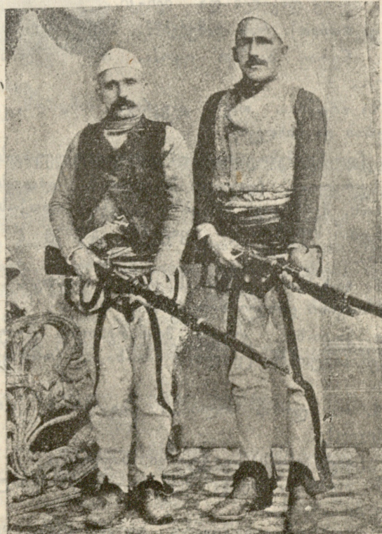
ალბანეთის აჯანყების გამო. ისხა ბოლშევიკი ალბანელთა ცნობილი ბელადი.