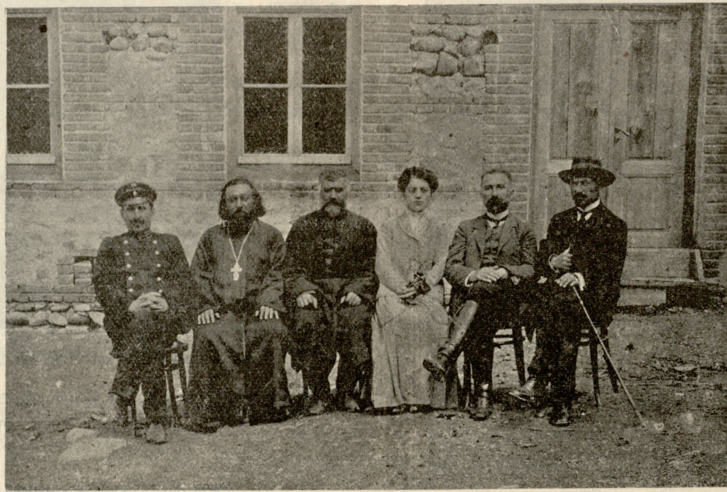
ს. გურჯაანის ბიბლიოთეკა-სამკითხველოს გამგენი. (იხილე სახალხო გაზეთი № 297)

არჩილ. (გა'ხეთს ათვალიერებს). აჰა!.. (აღეჭება დაეწყება; მწარედ ჩაფიქრდება).