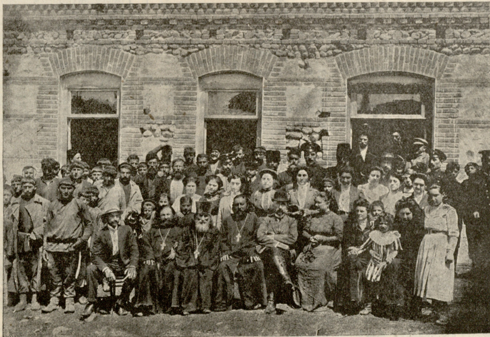
ს. გურჯაანის ბიბლიოთეკა-სამკითხველთა გამგენი და დამსწრე გლეხ- კაცობა, კურთხევის დღეს, ბიბლიოთეკის ახალ შენობის წინ.

თამარ. (დაფიქრდება). არც ისეთი პირახდილი... (ზაჟუზა). მართალი ხარ, ჩემო არჩილ: ძნელი ყოფილა უჩვევი აღა- მიანისთვის ასეთი ძალ-დატანებითა შრომა!.. მეჯადრე ჩე- მისთანა სუსტ; წარსული ცხოვრებით გარყვნილი ქალის- თვის!.. რაც უფრო მკაფიოდა ვგრძნობ ჩემ სიყვარულს არჩილისადმი, მით უფრო მრცხვენია, რომ ჩემი ფიქრების ნახევარიც ვერ გამომხელია მისთვის!.. განა შესაძლებელია სიყვარულში, მეგობრობაში მალულაობა? ღმერთო ჩემო, არჩილმა რომ ჩემს გულში ჩამოიხელოს!.. (ზაზღაჟ). სუს- ტო, გარყვნილო, თამარ!.. შენ აქამდისაც ვერ შეგიძლიან უშუროდ შეჰხედო გამოპრანქულ ქალებს, რომლებიც უზ- რუნველად დასრიალებენ ეტლებით!.. ასე მგონია, ქუჩაში ყველა ჩემს დაძვლებულ ტანისამოსს აქცევს ყურადღებას... დასცინის!.. მრცხვენია და თავი მეზიზღება ამ სირცხვი- ლისთვის!.. ჩემისთანა გარყვნილ ქალებს, ე. ი. მომეტებულ ნაწილს ურჩევნიათ კანონიერ საყვარლებად ყოფნა!.. ნამ- დვილ სიყვარულს ჩვენ შეგვიძლიან შევწიროთ მხოლოდ უთვალავი ცრემლი ჩვენი სისუსტისა!.. (ზაჟუზა). ძლიერია ცხოვრება!.. (დაფიქრდება. უცებ წამოხტება). რა წაიკითხა