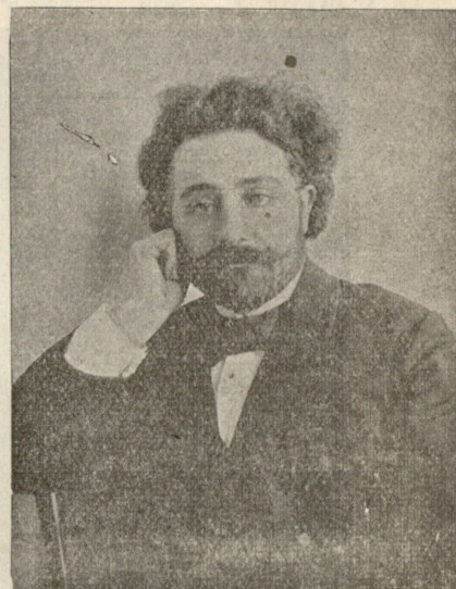
სომეხთა მწერალი და დრამატურგი შირვან-ზადე (ალექსანდრე მოვსესიანი) დღევანდელ იუბილეს გამო.