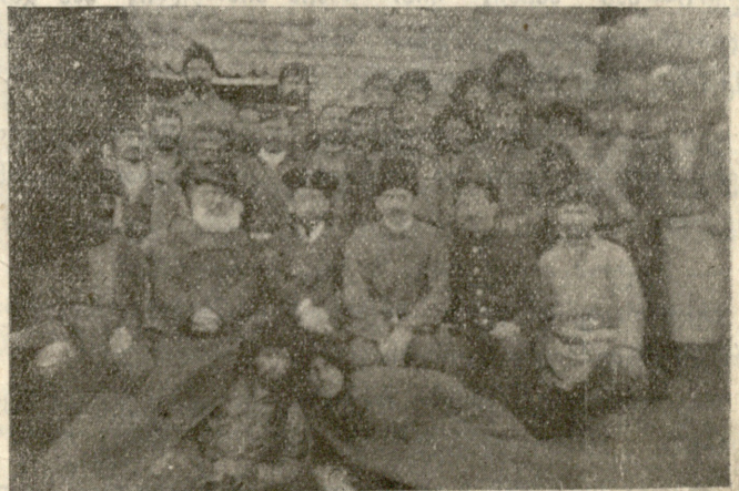
ზოფ. დიდი ლილა (ტფილ. მაზრა). წვრილი კრედიტის ამხანაგო-ბის გახსნა. ამხანაგობის წევრნი.

ცვლილება შემდეგმა გარემოებამ გამოიწვია. ერთს საღამოს ბიჭია სოფლის გორაკზე იჯდა და ჩონგურს აედერებდა თითონაც ნელის ხმით დაჰლიღინებდა. გორაკს ახ-ლო უვლიდა სოფლის შარა გზა. საქმიანი დღე იყო, და მუ-შაობით მოქანცული გლეხები ბრუნდებოდნენ ყანიდან შინ. ბიჭიას უნდოდა ჩვეულებრივ შემოეკრება ისინი გარშემო და გაემხიარულებინა მაგრამ ამ საღამოს ყველამ გვერდს