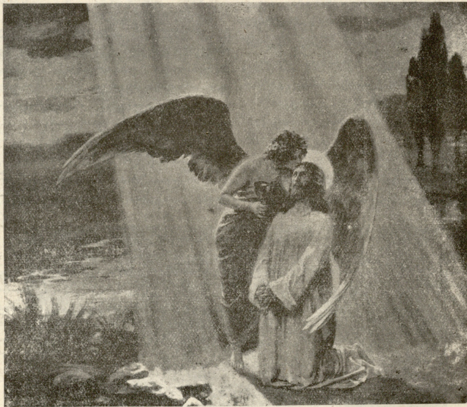
იესო ქრისტე გეთსიმანის ბაღში.

ოთარიშვილი დუღილს მიეკა, ჩაფიქრდა, თითქო უნდა გაიხსენოს ამბავიო. მსმენელთაგან ზოგი მიწაზე დასხდა და