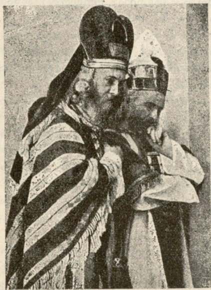
სურ. 5. მღვდელ-მთავრები ანნა და კაიაფი.

თავდაპირველად მოქმედება სწარმოებდა სასაფლაოზე. მაგრამ რაც უფრო მეტი ხალხი ეტანებოდა წარმოდგენებს, მით უფრო შეუძლებელი ხდებოდა აქ წარმოდგენების მართვა ვიწროების გამო. ამიტომ 1830 წელს წარმოდგენები გადაიტანეს იმ ადგილას, სადაც ეხლა თეატრია. მაყურებლები პირდაპირ ცის ქვეშ, გადაუხურავ ადგილას, ისხდნენ. გაავდრების შიშის გამო თან მოჭმონდათ ქოლგები და წამოსასხამები. მხოლოდ 1900 წელს გააკეთეს დახურული შენობა და ადგილები იწყება სცენიდან და ამფითეატრად აღის სცენის პირდაპირ გამართულ ლოჯებით. თეატრში სინათლე შემოდის ქერში დატოვებულ ნახვრეტით, რომელიც წვიმის დროს იხურება. გარდა ამისა, სცენასა და დარბაზის შორისაც დაუხურავი ადგილია დატოვებული. სცენის სიგანე თითქმის 20 საყენს უდრის; იგი შესდგება 4 ნაწილისაგან; ვეებერთელა აფანსცენის სიღრმეში მოთავსებულია შიგნითა დახურული სცენა, რომელსაც გვერდებზე უვლის იერუსალიმის ორი ქუჩა; შიგნითა სცენას აქვს მოძრავი ფარდა და ავდრისაგან დაფარულია სახურავით. სცენის დანარჩენი ნაწილები გადაუხურავია და მაყურებელთაგან არ არის გაყოფილი ფარდით. აფანსცენის მარჯვნივ მდებარეობს დერეფანი და შემდეგ მღვდელ-მთავრის ანნას სახლის წინაპირი კიბეებით; მარცხნივ მოსჩანს ასეთივე კიბეები პილატეს სახლისა. შიგნითა სცენა მოწყობილია ცხოველი სურათებისა და იმ სცენებისათვის, რომელთაც დეკორაციების გამოცვლა ესაჭიროება. წინა სცენის გასწვრივ ჩამწყვირდება ხოლმე გუნდი, აქვე ხდება მოქმედებები, რომელთაც დეკორაციების გამოცვლა არა სჭირია. როდესაც კი ხალხის ბრბო გამოდის და საჭიროა დიდი ადგილი, შიგნითა სცენა გაერთიანებულია გარე სცენასთან.