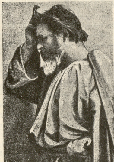
სურ. 6. მოციქული პეტრე.

განდევნა პირველის ადამიანისა (სურათი მე-3). პროლოგი კი მელიოდრამატული ესალმება დამსწრეთ და სთხოვს მათ მთელი არსება მიაპყრან უზენაესს. ამის შემდეგ გუნდი გვერდებზე ჩამწყვირდება და შიგნითა სცენაზე გამოჩნდება მეორე ცოცხალი სურათი— იესოს ჯვარის თაყვანის კემა. მოქმედება იწყება ბზობით. იესო ქრისტე მიემგზავრება იერუსალიმისაკენ. გარშემო მას ახვევია აუარებელი ხალხი. მხიარულის სიმღერით უფენენ ხის ტოტებსა და ტანისამოსს, ბავშვები მღერაინ „ოხანას“ (სურ. მე-4). ფარისევლები შორი ახლოდან შიშით ადევნებენ თვალყურს. იესო ეკლესიაში ჩარჩებს შეამჩნევს. განრისხებული გამორეკავს მათ იქედან და წააქცევს მტრედების გალიას. ჩარჩები გონს მოვლენ, შურის ძიებას მოიწადინებენ. მათ ლევიტები აქეზებენ და ურჩევენ მღვდელ მთავარს მიმართონ საჩივრით. მეორე მოქმედებაში გუნდსა და პროლოგის შემდეგ გამო-