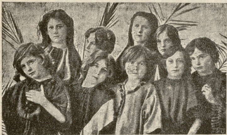
სურ. 4. ბზობა. ბავშვების გუნდი ჰგალობა „ოხანას“.