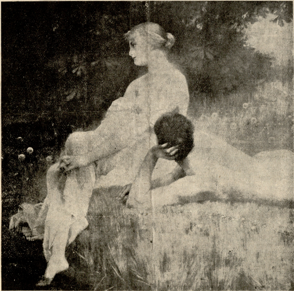
„კანეიონის ნავირად“ — სურათი ვინწენბერგისა.