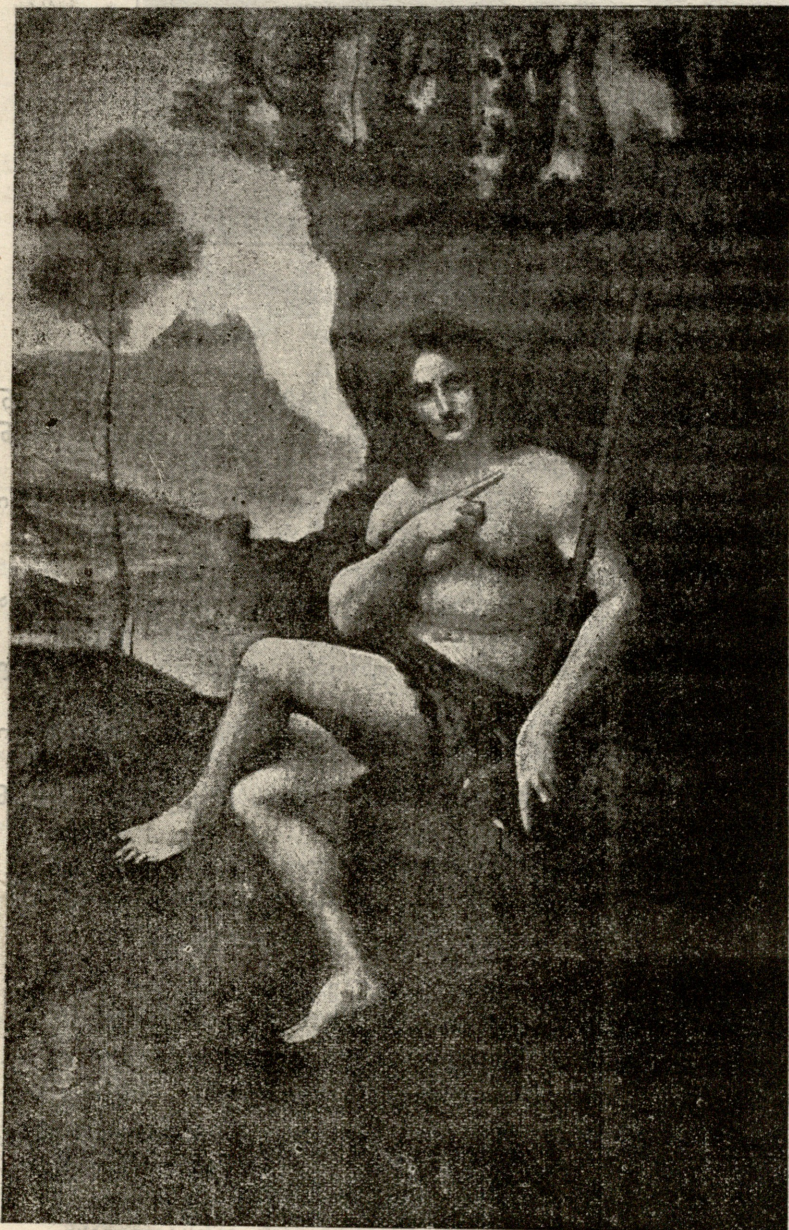
მუხამბი. — სურათი ლეონარდო და ვინჩისა.

ჩემს ბნელს ციხეში მოულოდნელად მეწვია დედა მოხუცებული, დღიდან ყრმობისა აღარ მიგვრძნია ასე მშობლის მე სიყვარული. დღიდან ყრმობისა, როს ცივ-გომბორის მთისა კალთებზე დაწვავარდობდი, ხან მოქანცული დედისა მუხლზე თავს მივაყრდობდი, მასთან ვლალდობდი! ასე ქურციკის ხტომა, ნაფარდი კონცხილამ კონცხზე ბევრჯელ მინახავს, მოუკლავს ერთი და დედის ყელზე მოქანცულს ყელი გადაუხლარდავს. ეჰ, გაჭკრა ის დრო, საამო სიზმარს კავასიონის წვერვალზე სძინავს, აწ სხვა ღრუბელი თავს მახვევია, სხვა ქარიშხალი ღრიალებს, გმინავს. მას ასდევს ჩემი ბედის ხომალდიც, ხან ქვესკნელშია, ხან აღმა აღის, მან უკუ აგლო თვის ნავთსადგური, ტალღებზე მიჰქრის, ზვირთზე გადადის! და ამ ტკბილ-მწარე წუთებ-წამებში დღეს კვლავ მომესმა დედის ნაზი ხმა, შეგვრთი, ვშიშობდი რკინის კუბოში არ დამიტრონ მისმა თვალებმა, მაგრამ მშობლის გულს, თვისა გამწარებულს, თურმე წამალი არ ესწავლება, და ის ერთია, რომ ჩვენ ნაღველ-წყულულს თვისად მიიღებს და მიუხვდება. „ნუგეში მტირალს, შენ ეს არ გინდა,— მომესმა უცებ, და ამათროლა, ვინც საფლავშია ცოცხლად ჩავიდა, მას იქაც ჰმართებს ბრძოლა და ბრძოლა!“ აი ანდერძი, რომელსაც ხშირად ამიერიდან ვუიღერებ ციხეს, მას ჩემი ბედის გულზე ამოვქრი, მას დავაწერავ მე ჩემს სიციცხლეს!