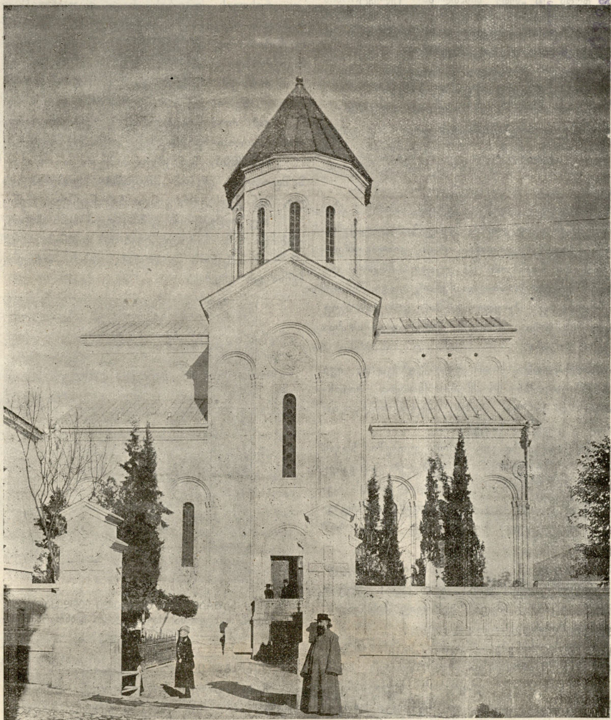
ქვაფხეთის წმ. გიორგის ბანახლეზული ტაძარი.

გახეთის № 148. კვირა, 31 ოქტომბერი 1910 წ. დამატების № 25