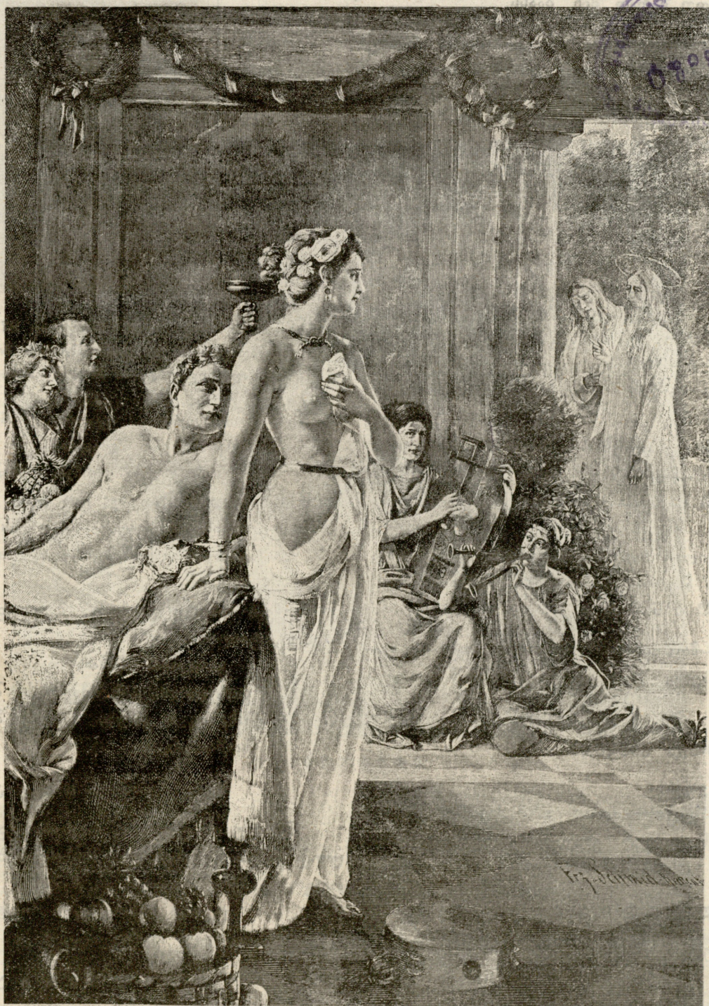
უმპირთალი მამალნი. — სურათი შმიტ-ბრეიტენბახისა.