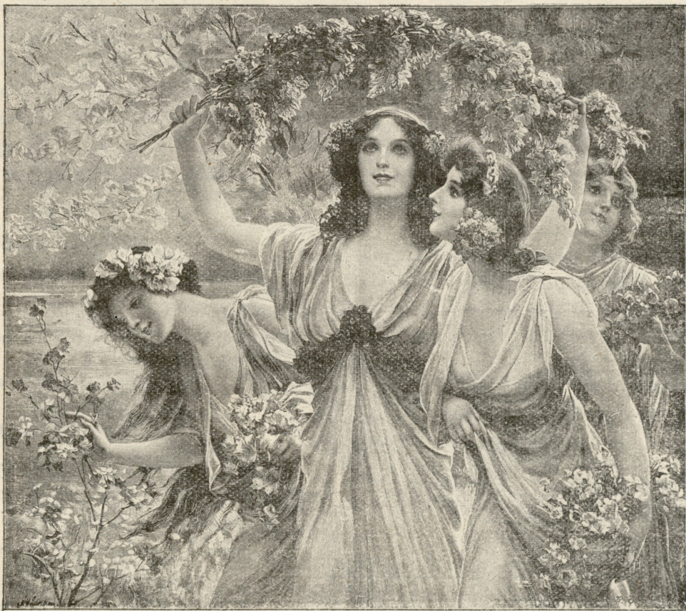
ყ ვ ა ვ ი ლ ე ბ ა შ ი .

მე ვიცი მხოლოდ თუ ჩემთვის რა ხარ! ოჰ, ტურფათა უტურფესო, ცით მოვლენილო! შენ ჩემთვის წმიდა ანგელოზი ხარ, რომელსაც ჯერ არ უხარე- ბია სამოთხის შეება, მაგრამ მახარებს, გამახარებს ჩქრა სავ- სებით.