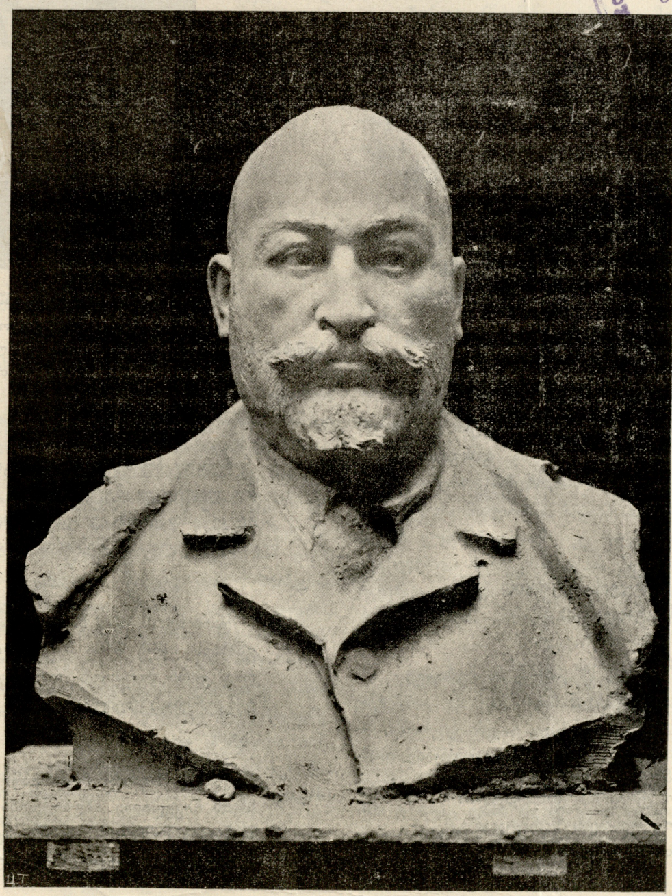
ეთიხ სასორე თოფურიას ბიუსტი. ქანდაკება ი. ნიკოლაძისა.