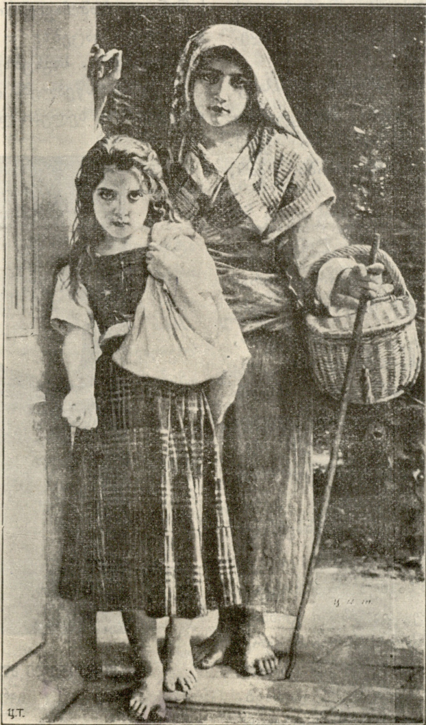
ორი ობოლი. — სურათი ბუგეროსი.

პარანმა სწრაფლ მაგიგო: — ჰო, ხან და ხან, ასეთ საღამოების დროს, ელექტრონის საღამოებზე... მე... მე... მეშინიან... მეშინიან... არ გესმის, რას ვამბობ! საქმე იმაშია, რომ მე შემიძლიან... ე. ი. მაქვს უფლება... არა, ძალია... არ შემიძლიან ავიხსნით, მაგრამ ხან და ხან ჩემში ისეთ წარმოუდგენელ მაგნეტიურ ძალაა