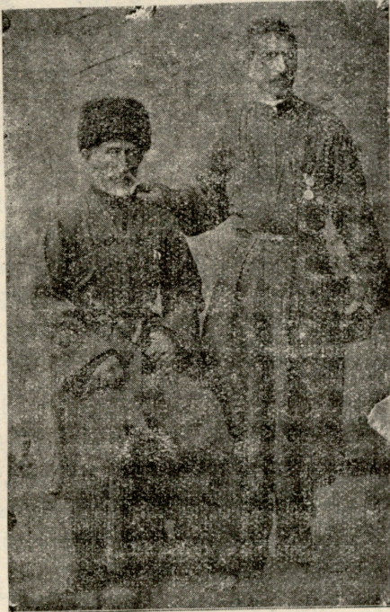
ინგილოური ტიპები (ქართველები).

ბოქ. როგორ აქაურები? კიდევ არ იშლიან? მგონი