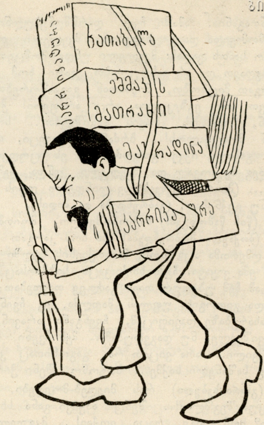
გზა სიარულმა დალია, სიბი ქვა წყალთა დენამა, ლამაზი ახალგაზრდანი ერთმანეთისა ცქერამა, სახელ-განთქმული ო. შლინგი კარიკატურის წერამა.

გაბო. (მიხას) დაიცა ნუსულელობ, თუ ღმერთი გწამს!.. (ფანას) ვიცი, ვანო, შენ სუ სხვანაირი ბიჭი ხარ... ვერც ბიჭობაში, ვერც ქკუაში და ვერც პატრონობაში ვერავინ გაჯობებს... ვიცი, რომ, თუ საქმე მოითხოვს, სიკვდილსაც არ გაექცევი. მაგრამ აი მე მოხუცი ვარ, მართალია, აქ სულელათ გამომიყვანეს, მაგრამ დამიგდე ყური... მე ძველი დროის კაცი ვარ, თქვენი ერთობისა და ამნაირებისა არა მესმის რა, ოღონდ ამას კი გეტყვი: მე მჯერა, რომ ათითხუთმეტი კაცი კი არა, იქნება ოცზე მეტიც გამოჩნდეს