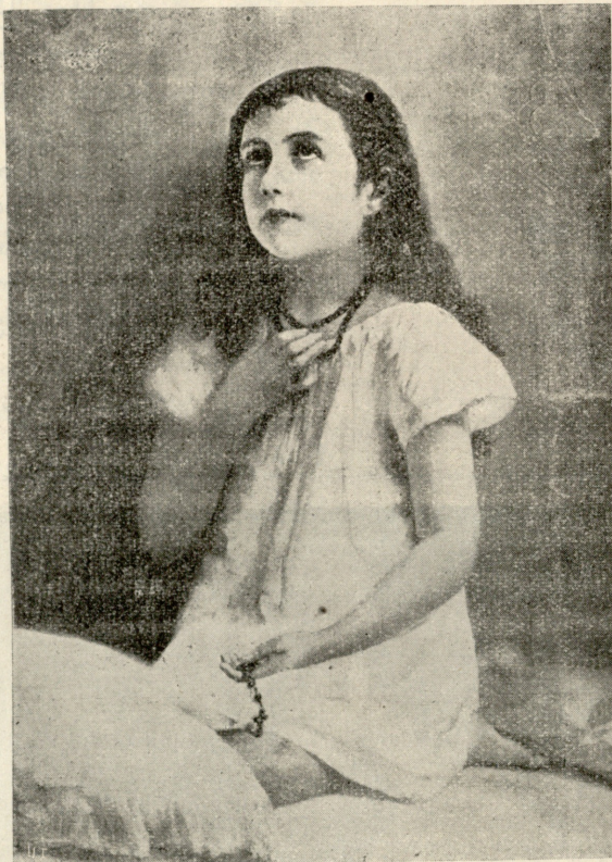
ლოცვა, — სურათი სერენდანტ დე ბელციმისა.