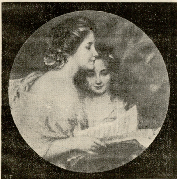
გაზაფხულის სიმღერა, — სურათი ინოსენტისა.