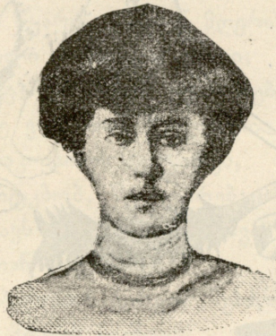
ტ ა რ ნ ზ ს კ ა ნ ი ა,

ბართლომე ივანიჩიც გაერია მოსიერნეთა შორის. ქვა-