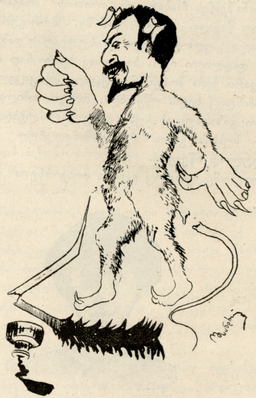
მ. ს. ა. კ. ი.

მეხრე უნდა მეხრეობდეს, ქარავანი ქარავნობდეს, შენისთანა იუმორისტი ცირკში უნდა ფალავნობდეს.