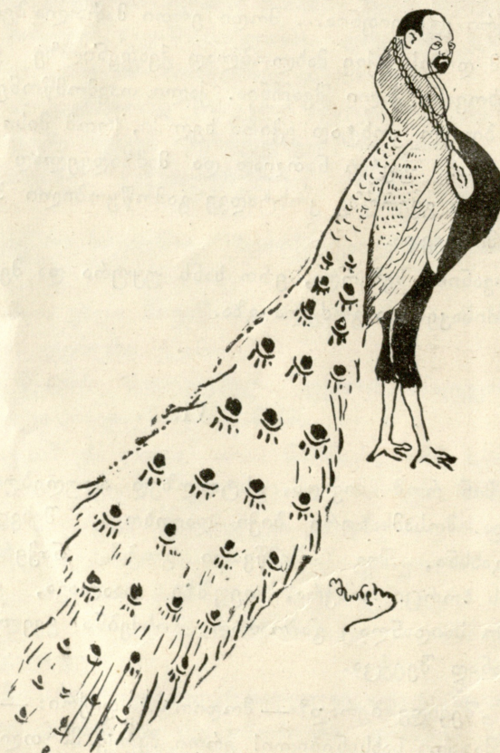
ა. ხ ა ტ ი ს ო ვ ი.