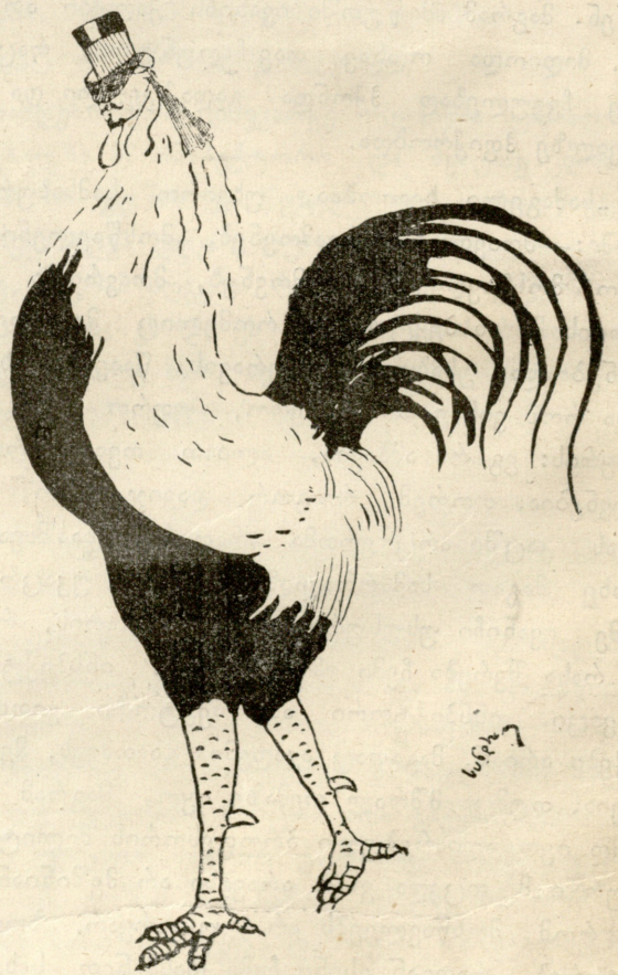
ბ. გ ვ ა ზ ა ვ ა.

მოფრინდა ორი ფრინველი, უცხო ბუმბულით, ფრთებითა; ყოყორობითა ერთი სჯობს, მეორე ოქროს ძეძკვითა.