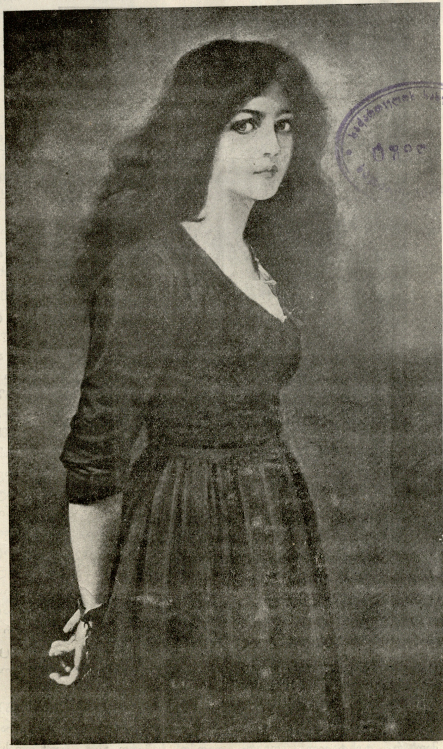
უსამართლოების მსხვერპლი, — სურათი ლინგერისა.

გაზეთის № 18. კვირა, 24 იანვარი 1910 წ. დამატების № 4