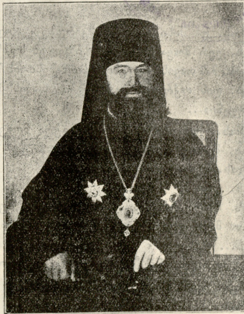
საქართველოს ახალი მკსარხოლსი ინოკენტი.