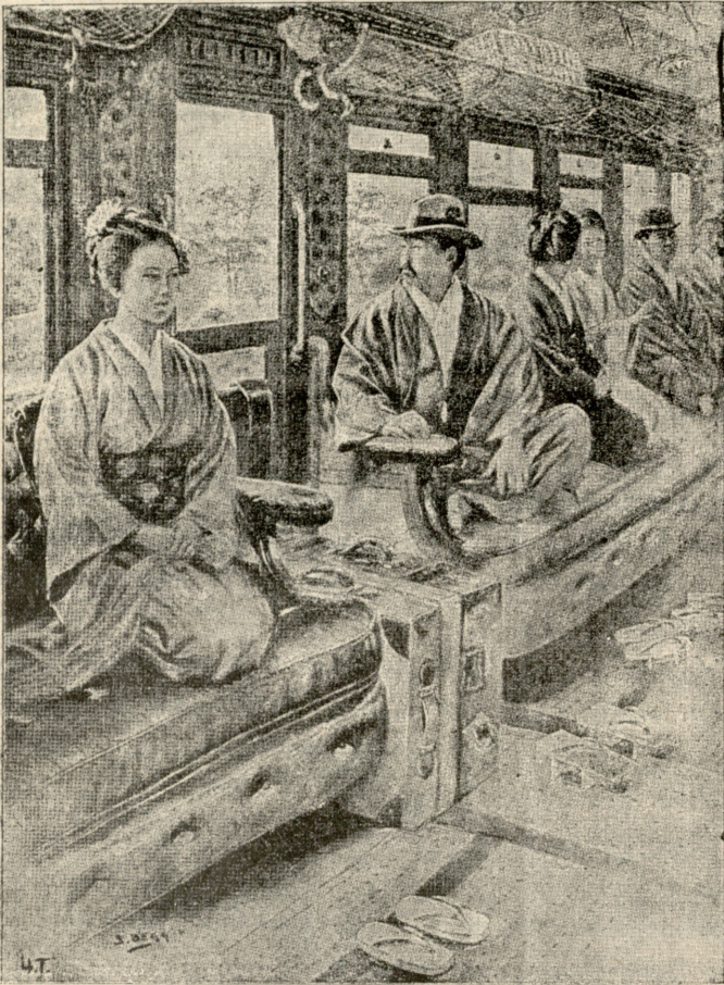
იაკონელაზი რკინის გზის ვაგონში.

ზედ მიეყარათ ქვა, ხეო, უხანას თავში დაეკრა, უთესას ეთქვა მკვახეო, უფარცხას, უღვაშ-გრეხილს ეცინა,—ეს რა ვნახეო! ლერწამი ამოსულიყო საფლავს დარაჯათ, არხეო, სიმართლეს ევედრებოდა, აღზდექ, ქვეყანა ნახეო. ველარ გაუძელ ამდელს ჯავრს, აქ ხერხი გამოვნახეო: ზარი დაუკარ მეზობელს, მოვიდა მოვაგლახეო; სიმართლე ცრემლით იტირა, იოხრა გულით: ვახ მეო! კალთით ვატარებ, მოგართმევ ოქროს აკვანსა რასმეო; გეძებდი ღუნია—ლეღეს, შენტვის სისხლის ოფლს ვანთხეო; რათ ქსურს დაგვეტოვო მარტოკა მომტირალ, მოვაგლახეო! ბოროტსა შურის ძიება თვალს პირდაპირ უძრახეო, ძმას ძმისგან დაჭრილ-დაკაფულს გულს შვება დაუსახეო! ღვთისა ტაძარსა ვვიგებდე, მოვიდეთ მოვაგლახეო, შევფიცდეთ ერთმანეთს ძმობას, იქ დავგმობთ მტრისა მახეო!