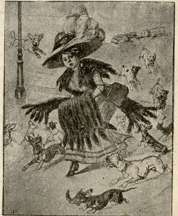
რა საზრთხე მოვლის ძალაგის ახალ მოდას.

ზარბში ამ ბოლო დროს გამოდის ახალი გაზეთი „ეროდუ კერუ-ვოლანტი“ გაზეთი ზატარა ბავშვებისთვის გამოდის და აზრად აქვს დააკმაყოფილოს ის ზატარა ბავშვები, რომელთაც ჭყარში ფრენა აინტერესებთ. გაზეთს რედაქტორებს თორმეტი წლის ბავშვი—ფორუ რუარი. გაზეთს უკვე 200 ხელის მამწერი ჭყავს და მათ შორის, რაგორც ამპარტაფნულად აცხადებს თორმეტი წლის რედაქტორი, არიან „დიდი კაცებიც“ ამასთან 12