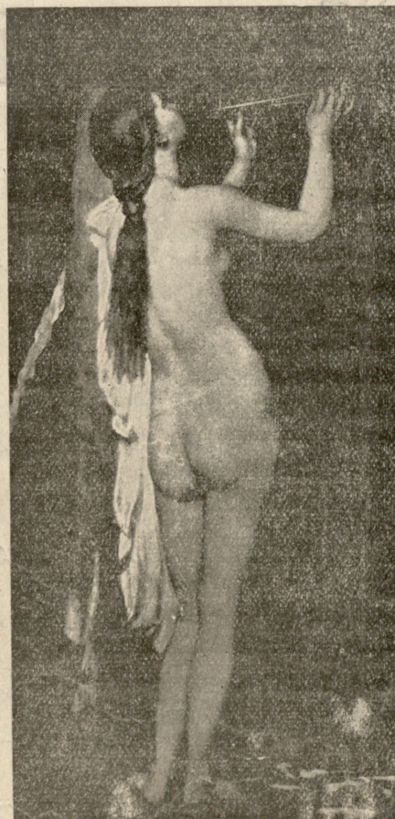
სალამური, — გვიერის სურათი.

— ქეთეთოს სახეა, პაწაწად გადავადებინე საათისთვის: მინდა მარად თვალწინა მქონდეს ჩემი ოცნების სურათი, მითხრა მიხამ და საუბარი სხვა საგანზე გადაიტანა.