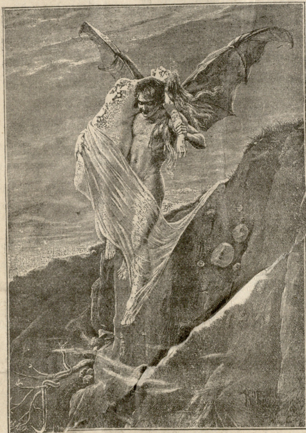
სატანა, — კობაის სურათი.

გაზეთის № 278 კვირა, 13 დეკემბერი 1909 წ. დამატების № 49