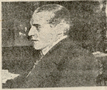
ჯონ პარსივალ ბიუზი.

ლიდერები ინგლისის კონსერვატიულ პარტიისა, რომლის მომხრეებმაც ლორდთა პალატაში უარ-ჰყვეს ქვედა პალატაში მიღებული ბიუჯეტი. ამ ამბავმა საოცარი მითქმა-მოთქმა და ბრძოლა გამოიწვია ინგლისში. ლაპარაკია ლორდთა პალატის (ზედა პალატა) გაუქმებაზედაც-კი.