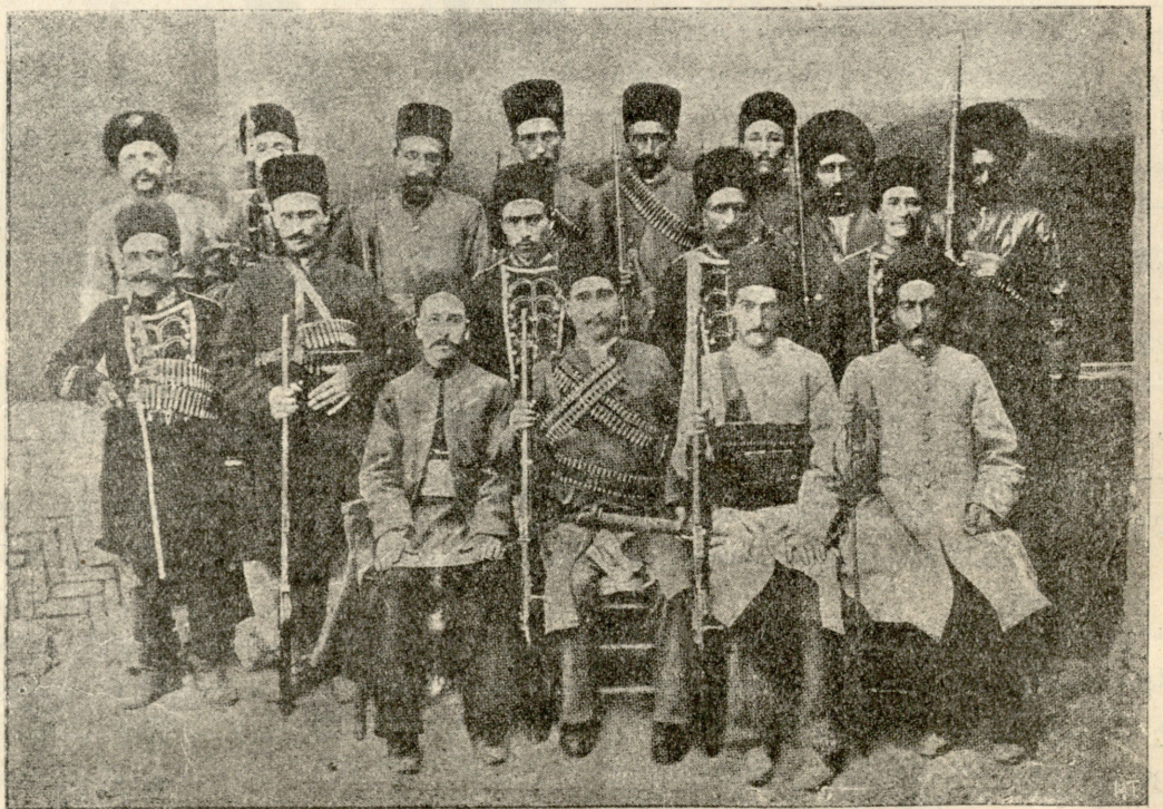
შ ა ხ ს ე ვ ნ ე ბ ი,

ჩემი ფიქრები უნებლიედ მიხასაკენ გაემართნენ და ნისლივით შემოვხვივინენ მის პიროვნობას. საიმედო კი ვერა შენიშნეს რა: კაცი თავგანწირული იყო, თითქმის ატაცებული და საშიში იყო, არა აეტენა რა თავის თავისათვის სასოწარკვეთილის, უიმედობის შხამით დაგესლილს. ეს იყო მი-