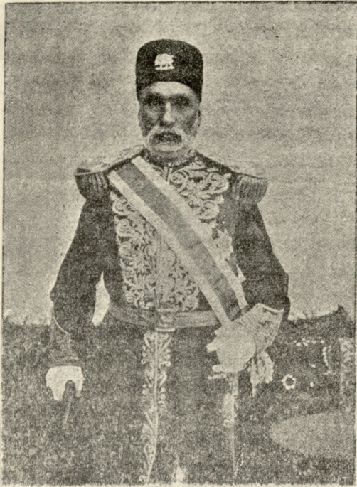
რ ა ხ ი მ - ხ ა ნ ი,

— დიასახლისის მხარე უნდა დავიჭირო: უცხოელნი და ჩვენ არა ვვარგევართ ერთად ოჯახში. სხვა და სხვა ნაირი