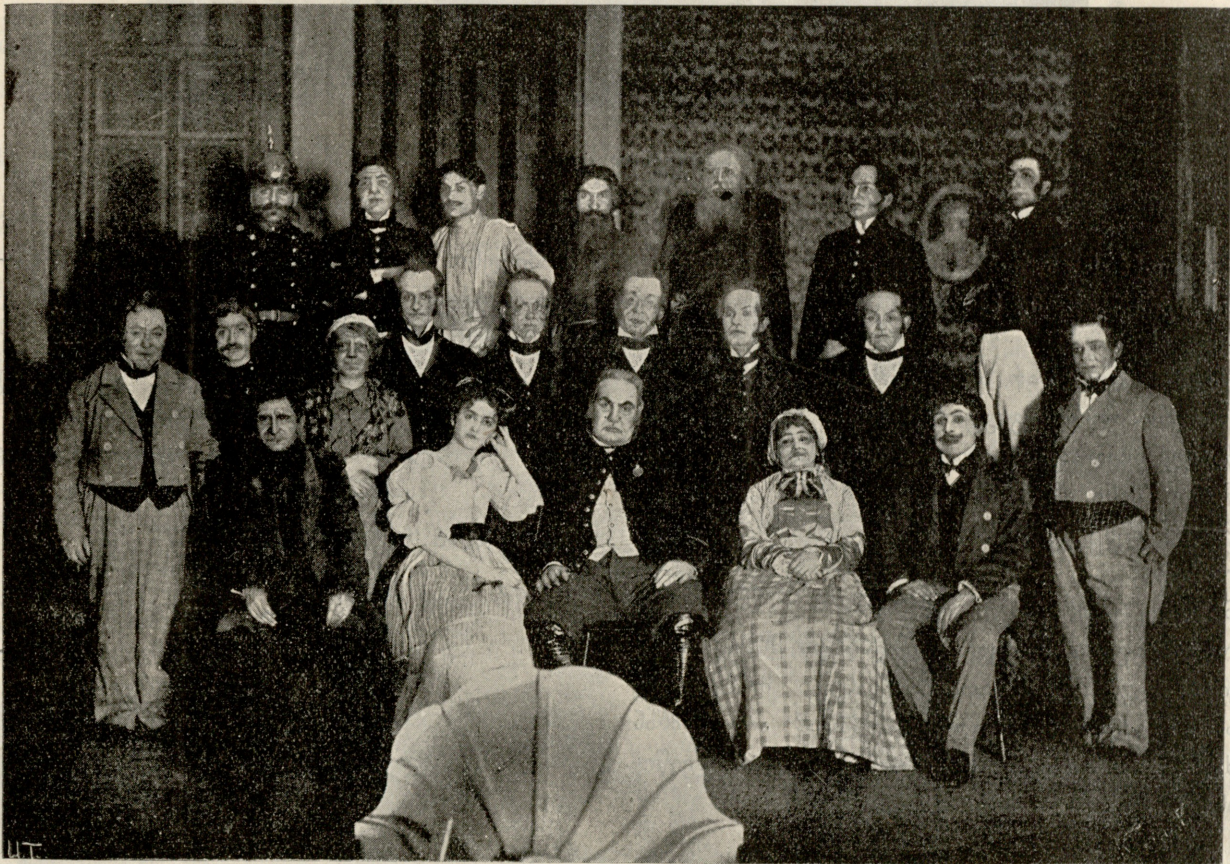
„რევიზორი“ სახალხო სახლის სცენაზე.

— ჩემო ღვთაებავ, ჩემო იმედო, ჩემო ნუგეშო! იქნება შენთვის მცირე არის ეს ჩემი მსხვერპლი, მაგრამ ჩემთვის კი იგი არის მთელი სიმდიდრე, ყველაფერი! მე იმის მეტი აღარა მაქვსრა... მაგრამ, ოჰ, ცოდვილს მპატიოს ჩემმა ღვთაებამ: მე კიდევ მაქვს ერთი სიმდიდრე, ერთი განძი, ერთი ქონება! ობლად შთენილმა, განდევილმა, მარტოთ მავალმა მე