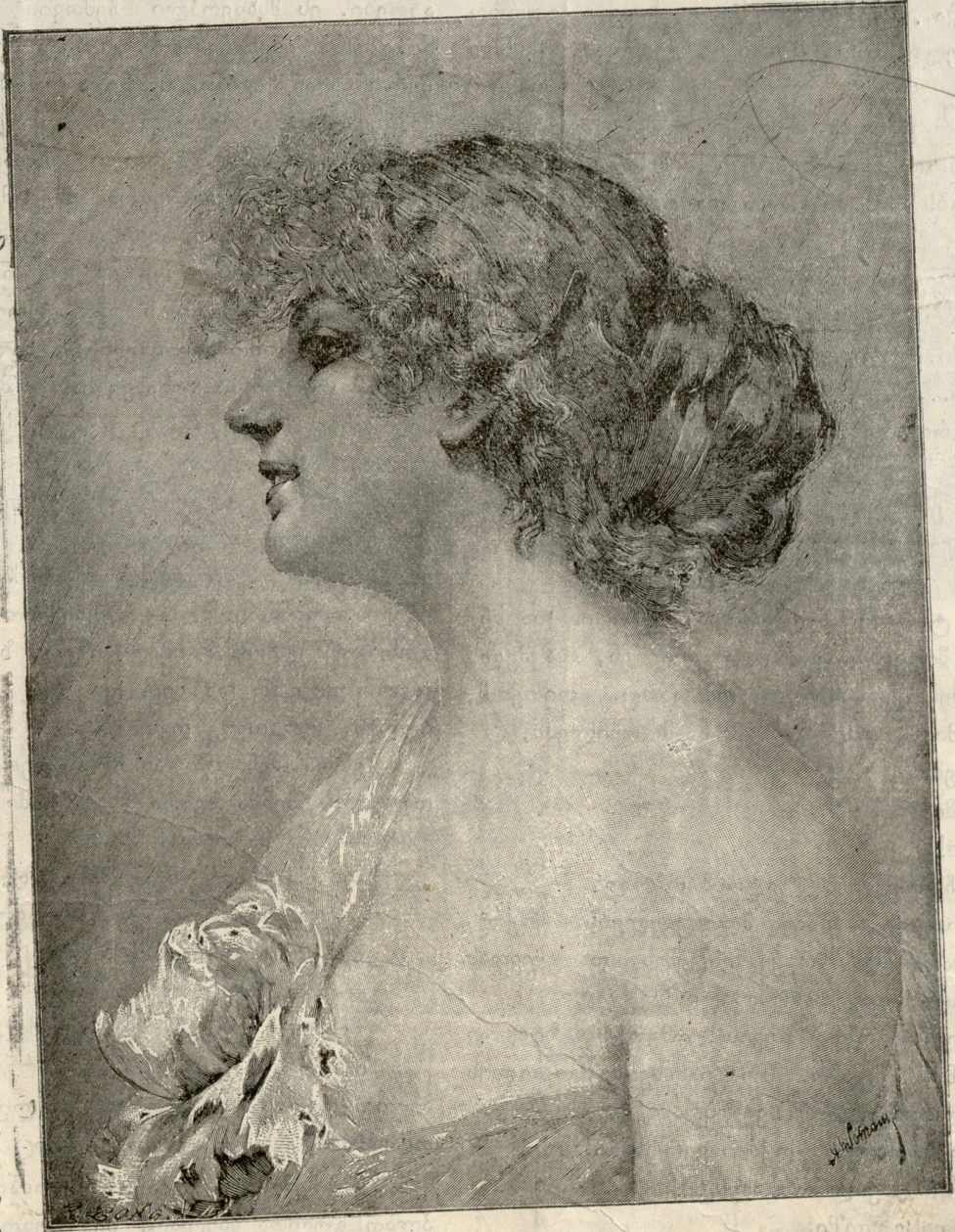
ეტიუდი, — სურათი სამოკიშისა.

—:— გაუვალ უდაბნოში, ქვე- ყნად წოდებულში, სცხო- ვრობდა ობოლი. მრავალფერ ცხოვრება- ში, თვალუწვდენ ქვეყანა- ზე რად დარჩა ობლად, — თვითონაც არ იცოდა და ვერც მიმხვდარიყო. თითქოს იგი დაბადები- დან სცხოვრობდა ხალხში; ადამიანთა შორის მიჰქრო- და მისი სიცოცხლე მსწრა- ფლად მავალი, მაგრამ ვე- რას დროს ვერც ერთ იმათგანს იგი მაინც ვერ უერთებდა თავის ობოლ გულს ან თავის ტირილით. ან თავის სიცილით. იგი ყოველთვის იღიმოდა მარ- ტოდ, ცრემლს ჰღვრიდა ობლად, განცალკევებით.. ცხოვრების ფართო გზა- ზე, სიკვდილისკენ მიმა- ვალზე, სადაც ცოცხალნი ადამის ძენი ყველანი ერ- თად მიემართვიან, იგი ყო- ველთვის მიდიოდა სხვის მოშორებით. ხან გაუსწრე- ბდა სხვა დანარჩენთ, ხან კი სულ ყველას ჩამორჩებოდ მაგრამ მარადის მიდიოდა მაინც სულ მარტო მაინც ობლად, განცალკევებით..