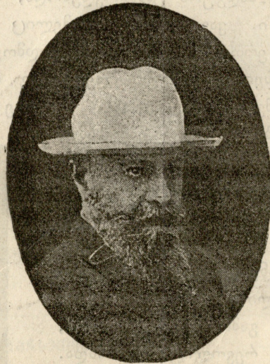
თავ. ა. მ. მარისტავი,