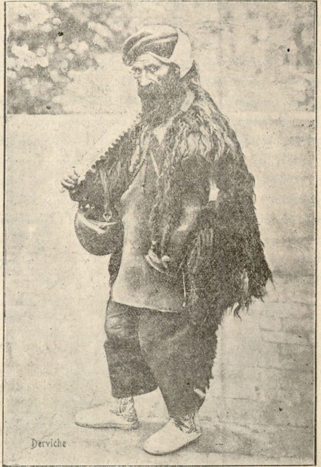
სპარსეთის ცხოვრება. — დერვიში.

მაგრამ, როდესაც ცხოვრების დაულევენლომა ბოროტებად, დაუსრულებელმა ეკალ-ბურღმა შენს ნაზ გულს მეტად მწარედ უწყეს ჩხვლეტა, ფაფარი არ დაგიდრეკია, მაგრამ თითქო უნებლიეთ ამოიკენესე: