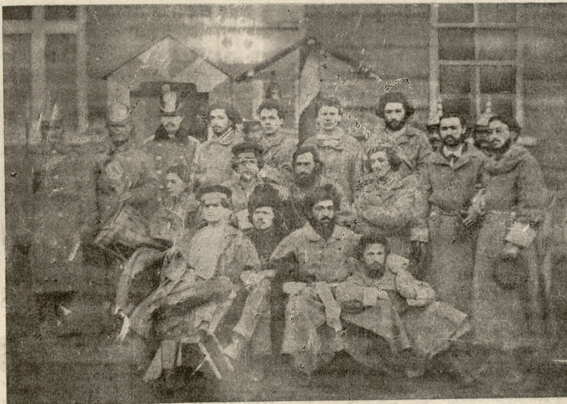
ჯგუფი სტუდენტებისა, დაპატიმრებული არეულობისათვის მესამოცე წლებში.

იროდია. განა მკვდრეთით აღადგენს ის კაცი?