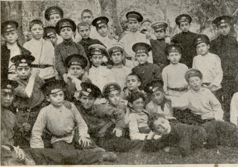
ტფ. ქართულ გიმნაზიის მოწაფეთა ექსკურსია.

მოწაფენი სხედან არმაზის ღვთის-მშობლის ეკლესიის გალავანში.