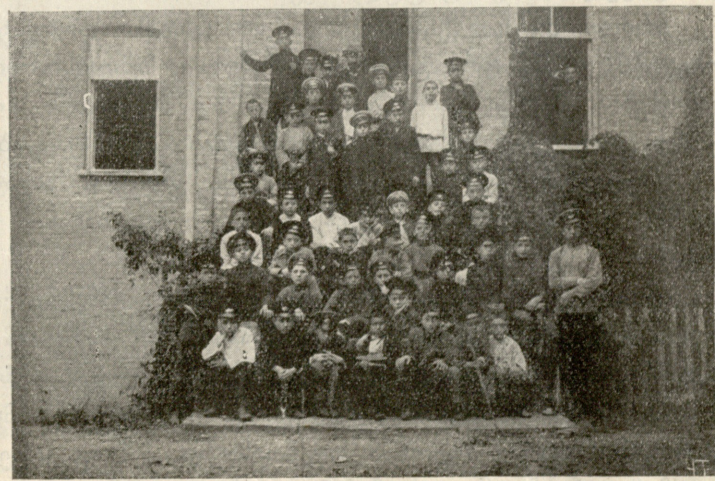
ტფ. ქართულ გიმნაზიის მოწაფეთა ექსკურსია.

1 იუდეველი. მართალია, ღმერთი სასტიკია. როგორც როდინში ინაყება მარცვალი, ისე ღმერთი ანადგურებს სუს-