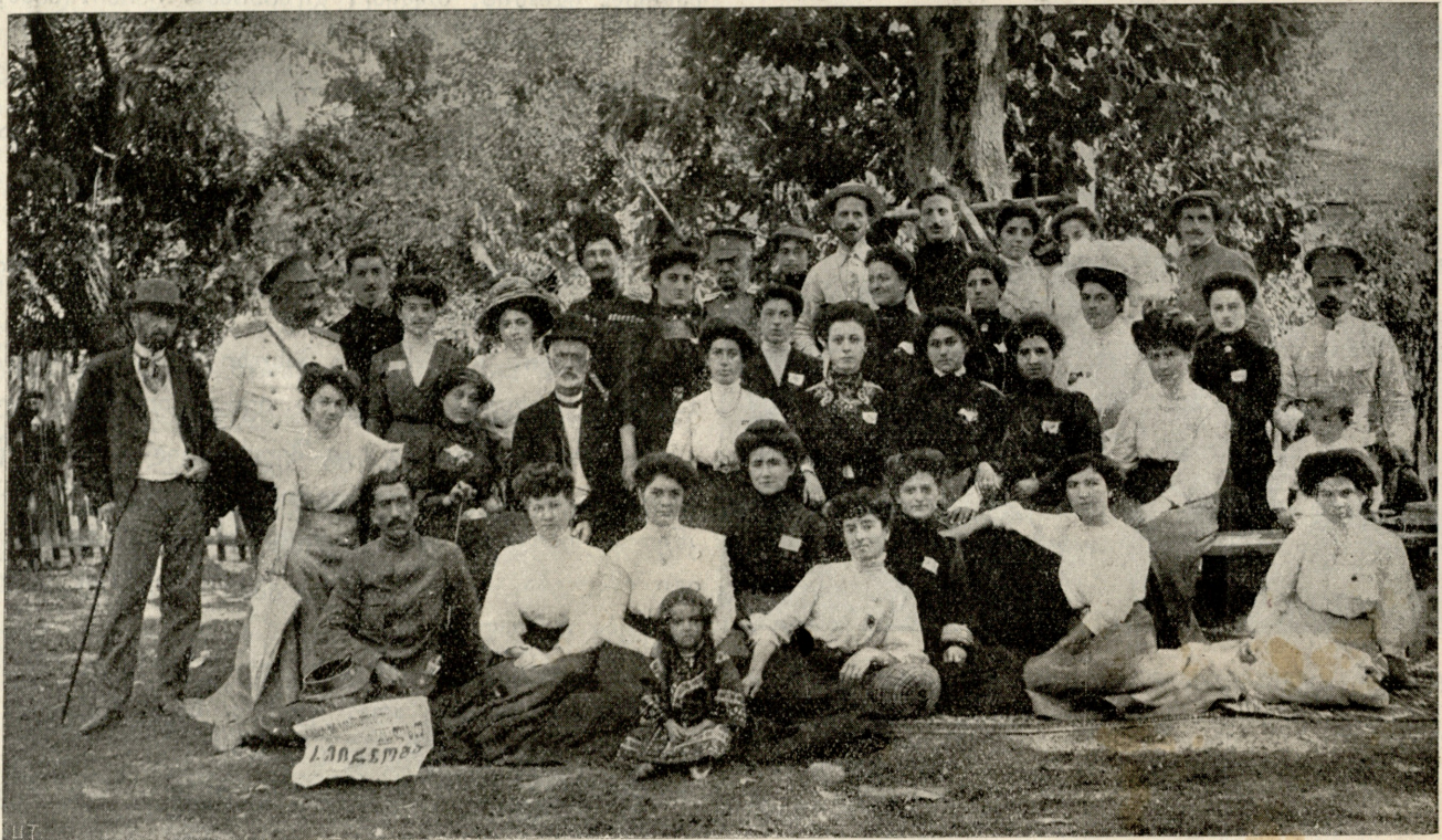
ოზურგეთში მომავალ რეალურ სასწავლებლის სახელობაზედ სეირნობის გამმართველნი.

ექვს ენკენისთვის ოზურგეთში გაიმართა სახალხო სეირნობა მომავალ რეალურ სასწავლებლის სასარგებლოდ.