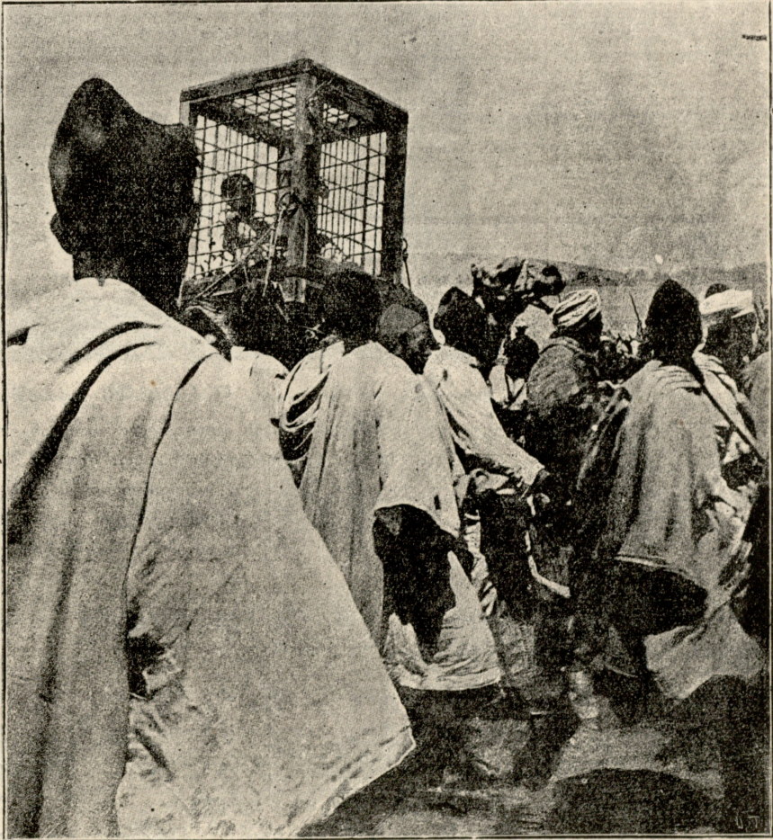
მაროკოს ტახტის მაქიზანელი როგი გალიაში.

დედა. ახ, არჩილ! რა საჭიროა ეგეთი შავი ფიქრები! არჩ. საოცარია! ოცნებებს თითქოს არაფერი საზღვრები არა აქვთო, ისე თავისუფლად გადასტოპამ ერთი მხრიდან მეორეში.