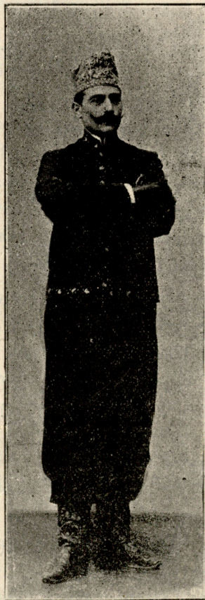
დანეილი მოგზაური და შუკნალისტი პატუჩასანი.

ამ მოგზაურმა მოიარა მთელი ევროპა, რუსეთის აზია, ოსმალეთი, სპარსეთი და სხვა ქვეყნები. რევოლუციის დროს კავკასიაში იყო და მთელი წიგნიც გამოსცა მოძრაობაზე. ამ წიგნში ქართველებსაც ეხება. ეხლან ტფილისში იყო და ამ ერთი კვირის წინად სპარსეთს წავიდა.