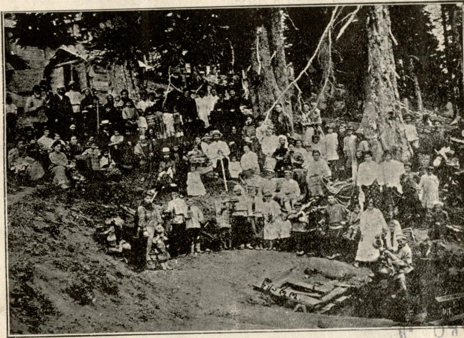
აბარაკი ბახმარო. ვაკი-ჯვრის ქუჩის წყარო.

სვიმ. თუ არაფრად, მაშ რაღად გეინტერესებათ მისი გამო-