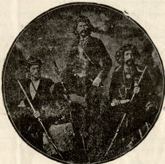
გათუვის ოლქში მცხოვრებნი ლაზები.

არჩ. ო, სიყვარულო! რაკილა დამიმორჩილე ეგრე ძლიერად, ეგრე მოულოდნელად, მაშ ნულარადროს ნუ გამანთავისუფლებ, რადგან ამ დამარცხებაში ვგრძნობ უზომო ბედნიერებასა და სიხარულს, უზომო შვებასა და ნეტარებას!..