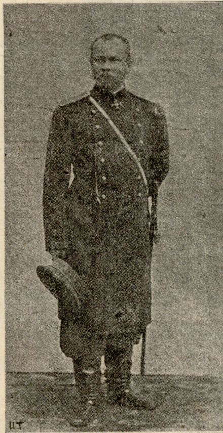
გენერალი ნ. ნ. ნ., რუსის ჯარის უფროსი თავრიზში.

ვეფხვი მარდათა წამოხტა, ხელით იფშენეტავს თვალსაო; მივიდა და ეამბორა კლდეზე მომდინარ წყალსაო. წყაროს წყალი სევა მთურადა, სიცივით გულსა სწვამსაო; წამოჯდა მუხლის თავებზედ, მითვე პირს დაიბანსაო. პირ-წაღმა დადგა, ლოცულობს,