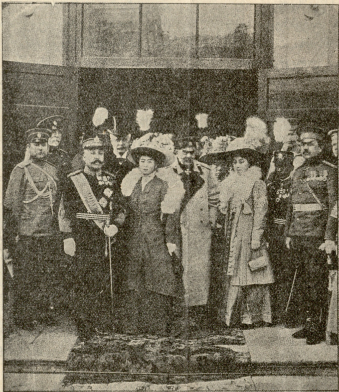
იაპონიის პრინცი ნაჰიომოტო (მეორე მარცხნიდან) და პრინცესა იცუჰო (მესამე მარცხნიდანვე)

პრინცი ავსტრიაში იყო, მერე პეტერბურგსაც ეწვია ამბობენ, ავსტრიაშია და იაპონიამ კავშირი დასდეს რუსეთის წინააღმდეგ და პრინ- ცი ავსტრიაში ამის გამო იყო.