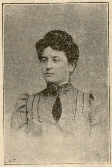
არტისტი ქალი დავითაშვილი (მის გასტროლების გამო ტფილისში)

— მომეცი, მე შევეხები: მე დიდება ვარ. ჩემ მიერ არჩეულ ადამიანს ავიყვან ისეთ სიმაღლეზე, სადაც ყოველი ადამიანი დაინახავს. სიკვდილის შემდეგ ამისთანას არ ივიწყებენ, მისი სახელი მთელი საუკუნოები სცოცხლობს, ერთი საუკუნე გადასცემს მეორეს. წარმოიდგინე, მთელი საუკუნოები არავინ დაგივიწყოს!