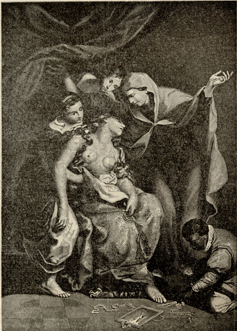
მოხანაშვილი მამალისა, სურათი რემბრანდტისა.

ბოდა, ფართოვდებოდა. ტყის პირში, ხევის მარჯვენა ფერდობზე, გამოჩნდა სოფელი. გვირაბიანიაო, უთხრეს. გზა ზევით დარჩენილიყო. ეგრე იარე ხევ-ხევ და ზედ მიხვალ დიასამიძის სასახლესთანაო, მიასწავლეს. უახლოვდებოდა ფარნაოზი სოფელს და გული უფრო და უფრო უძგერდა, უჩქროლავდა, საგულეში აღარ დგებოდა. ეხლაც თუ ასცდა საძებარს, ეხლაც თუ ვერ იპოვა თავისი სულისდგმა, სევდა გულს გაუპობს. აქამდის რომ მოუთმენლად ისწრაფიდა წინ, ეხლა უნდოდა გაგრძელებულიყო ხანი, ცხენი შეაფერხა: ეშინოდა მოეახლოვებინა გაცრუებულ