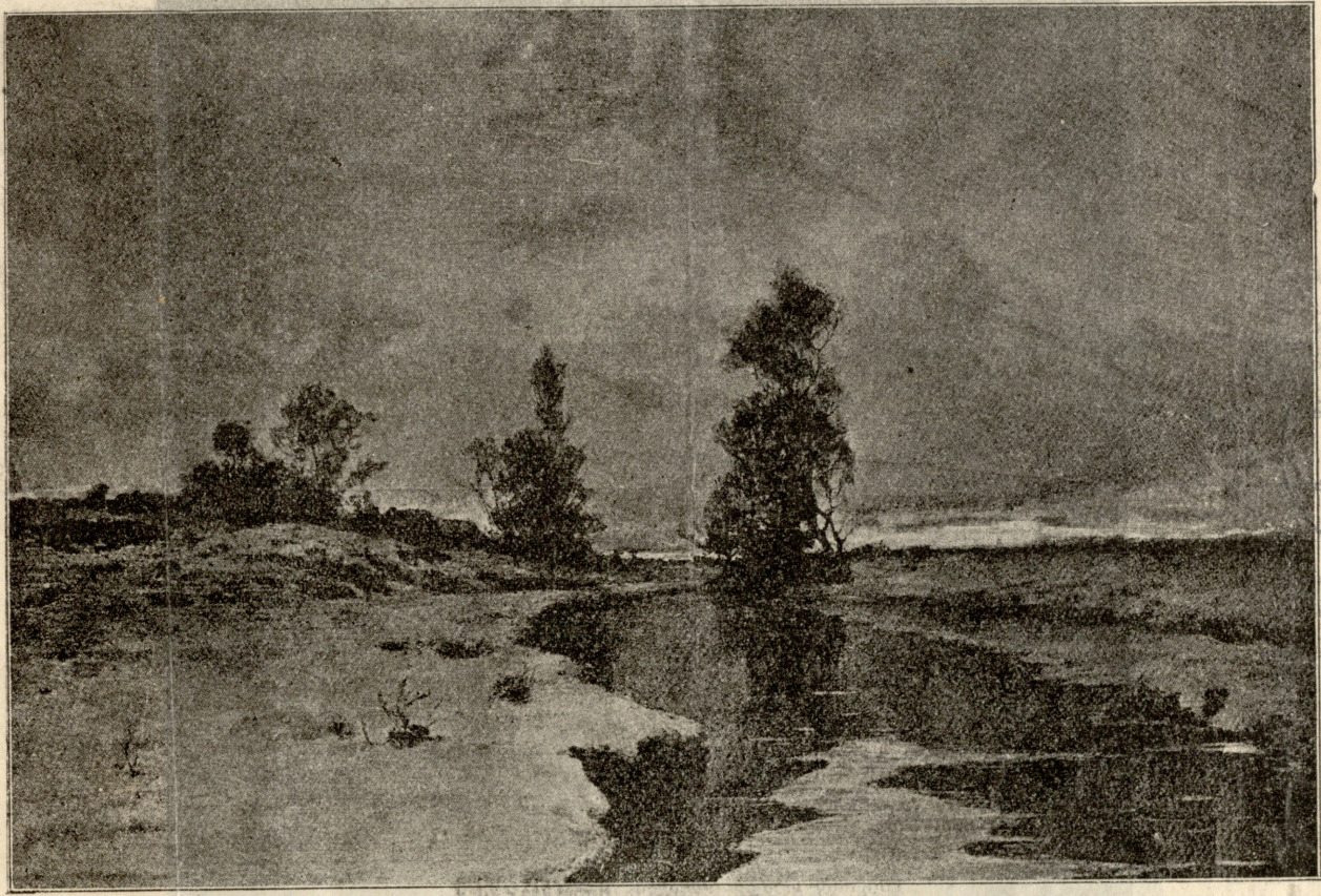
გაზაფხული, სურათი ენდოგუროვისა