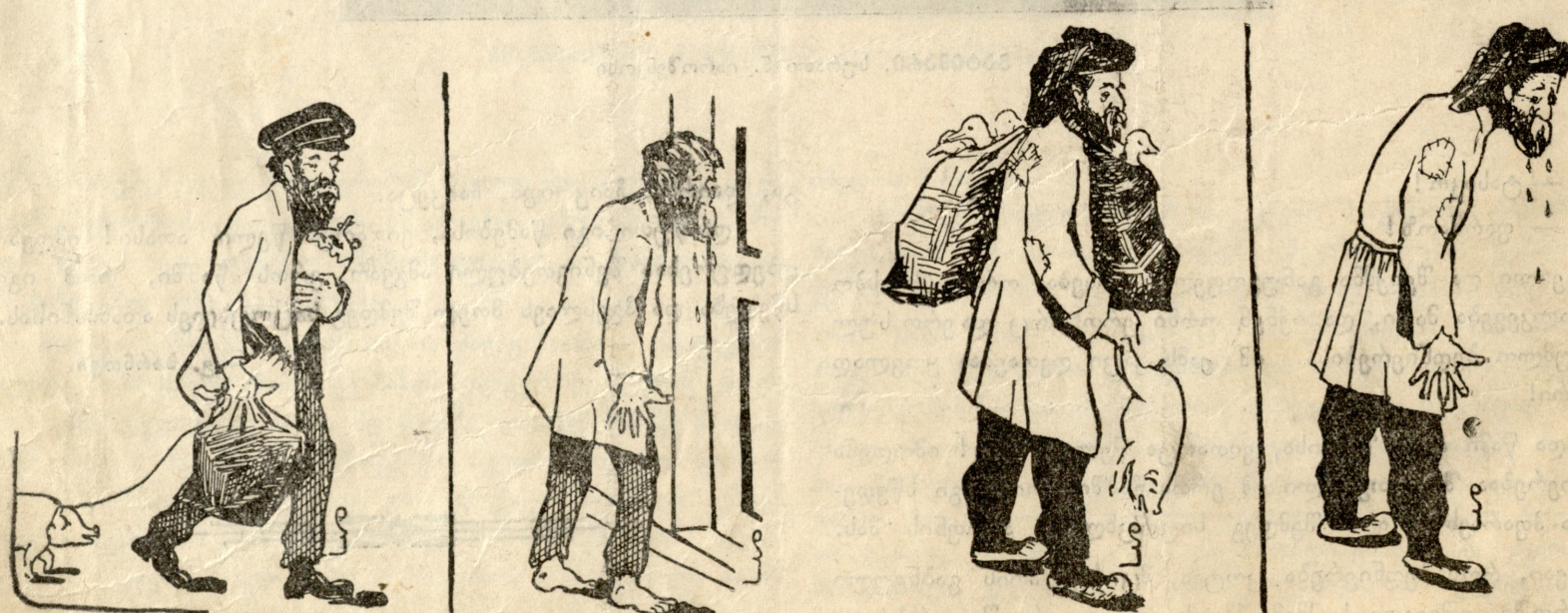
ქალაქელი ალღომის წინ ალღომის შემდეგ სოფლელი ალღომის წინ ალღომის შემდეგ

სტატისტიკა ინგლისის შესახებ. „სტატ. მან. კ.-ბოჯ.“-ში გამოქვეყნებულია სტატისტიკური ცნობები, საიდანაც ვიგებთ ინგლისის სიდიერეს და სიდიდეს. მთელი ინგლისის სამეფო 11 1 / 2 მილიონ ოთხკუთხ მილს შეიცავს. აქედან თვითონ ინგლისს უჭირავს 121,390 ოთხკუთხ მილი, ინდოეთს—1,766,517 მილი, ახალშენებს და პროტექტორატებს—9,548,579 მილი. მთელ იმპერიაში 392,211,617 სული სცხოვრობს. აქედან თვითონ ინგლისში არის—44,100,231 სული, ინდოეთში—294,317,052 სული, ახალშენებში—54,328,414 სული. 1908 წელს ინგლისში შეუტანიათ 10,865,081,020 მანეთის საქონელი, გაუტანიათ—10,091,964,920 მანეთისა. მთელს იმპერიაში რკინის გზების სიგრძე უდრის 730,527 ვერს.