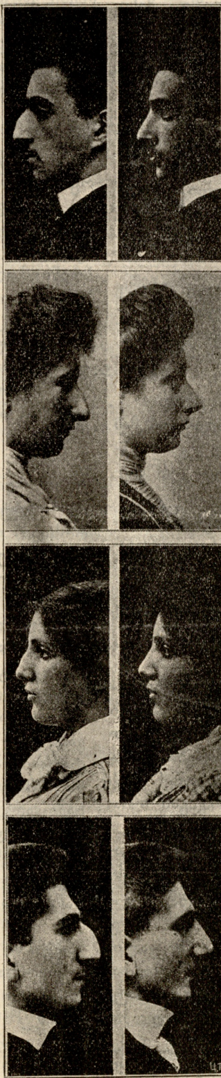
ოპერ წინად ოპერ შემდეგ.

იორამემ ხანგრძლივ შეხედა თევდორეს და ჩაფიქრდა. მიხვდა ის, რომ მართლა და ვიდასიც ძლიერი მარჯვენა მოქმედებდა აქ და არ ინდობდა არც მეფის სურვილს, არც არსიანელთ. მაგრამ ვინ უნდა იყოს მოქმედი ან რა აზრით უნდა მოქმედებდეს იგი? სააკაძე ყოველთვის თავს ევლებოდა მეფეს, თვალხმირად იყო, რომ მეფის გარემო სხვა რამ ძალა არ გაბატონებულიყო მის ნაცვლად, არ დაენთქა სარდალი, და ეხლა ეს იყო მიზეზი, რომ ამ ამბავმა ძალიან დააფიქრა ის.