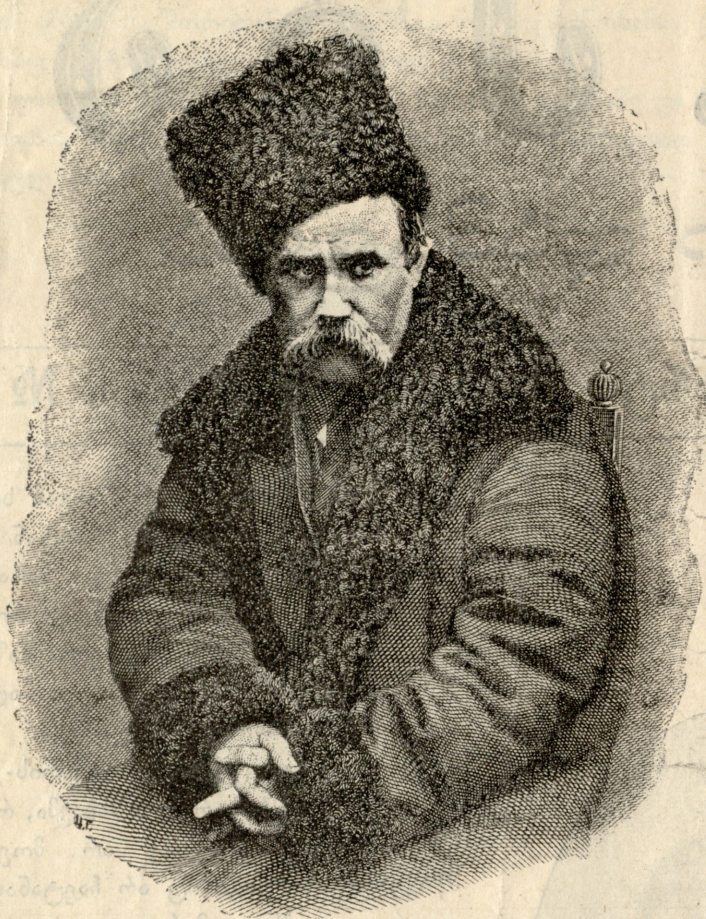
უკრაინელთა პოეტი მხვინჯაძე

დაღუბა. დააბატონრეს ყაფლან არსიანელიც. უნდოდათ თავი მოეკვეთათ, რადგან დაუმტკიცდა, რომ წინათ მოღალატეებთან მისვლა-მოსვლა და კავშირი ჰქონდა, მაგრამ მეფემ შეუმსუბუქა მას სასჯელი: დაბატონრება მიუსაჯა თანაც ციხეში კი არ ჩამწყვდევინა ის, თავის საკუთარ სასახლეში დააბატონრა, სასახლის ერთ-ერთ საკანში. ესეთი აღმოჩნდა მეფის შეურყეველი ნება. მთელი სარჩო-საბადებელი შეთქმულებისა აკლებულ იქნა ან სახელმწიფოთ დაიდო.