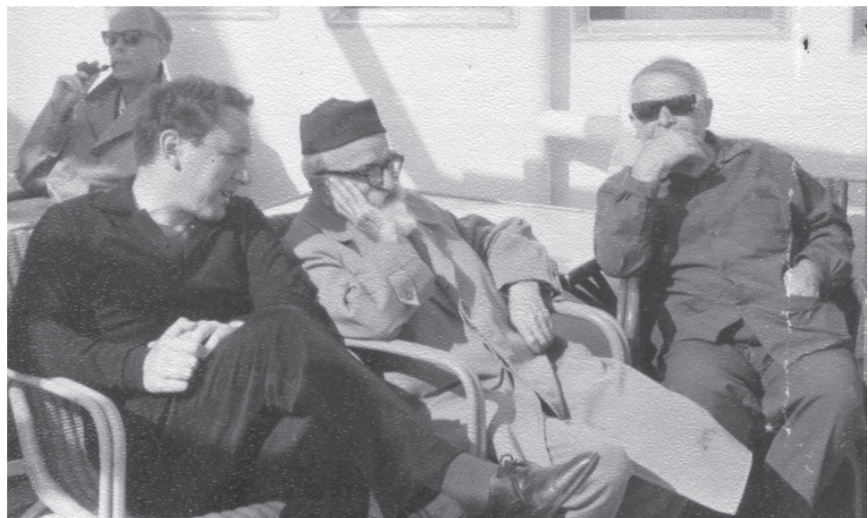
ვაჟა ოკუჯავა ივანე ბერიტაშვილთან ერთად

დღეს საქართველო სამართლიანად ამაყობს ბატონ ვაჟა ოკუჯავას აღზრდილი მეცნიერებით. მისი მონაფეები კი ბატონ ვაჟასთან თანამშრომლობის წლებს მაღლიერებით იხსენებენ და აღნიშნავენ, რომ მასთან მუშაობა ადვილიც იყო და რთულიც, რადგან, რამდენადაც უშუალო და კოლეგიალური იყო მონაფეებთან ურთიერთობაში, იმდენად მკაცრი და პირუთვნელი იყო მათი ნაშრომე-