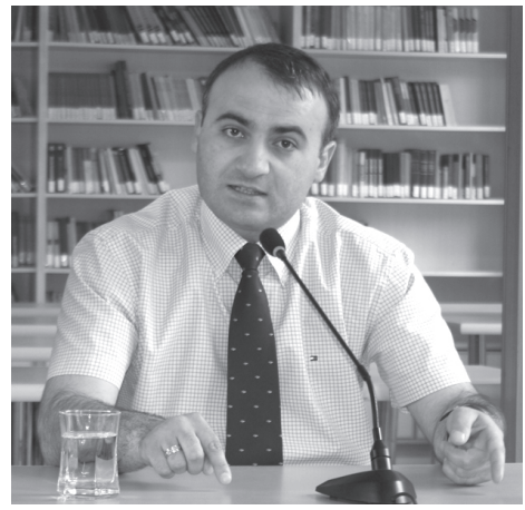
გადაცაოთ. ამ სახლებში შესახლებულ თითოეულ პირს 200 ლარის ფულადი დახმარება აღმოუჩინეთ. აღსანიშნავია ის ფაქტიც, რომ ფართს, სადაც აფხაზეთიდან დევნილები წლების განმავლობაში ცხოვრობდნენ, სახ-

კითხი სხვადასხვა კუთხით შეიძლება განვიხილოთ. მნიშვნელოვანია, რომ ლტოლვილებს ეს სახლები და მასზე მიმაგრებული მინის ფართობი პირად საკუთრებაში გადაეცემათ. ხშირად ჩვენი ოპონენტები გვსაყვედურობენ, რომ სახლები საცხოვრებელ პირობებს არ აკმაყოფილებს, მაგრამ ეს ასე არ არის. ისინი კაპიტალურად ნაშენი სახლებია და კარვის პირობებს ნამდვილად ჯობია. უამრავი პროგრამა ხორციელდება ფინანსური დახმარების კუთხითაც. დევნილი მოსახლეობის 100% - ს სწავლის საფასური სახელმწიფომ ერთი წლით დაუფინანსა. სკოლის მოსწავლეებს სწავლის დაწყებისას 100 ლარი