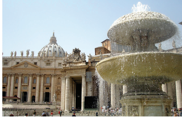
მასალა მოამზადა მანანა მიქელაძემ

ვატიკანში განახლეს ცოდვათა სია და უძველეს დროში შექმნილ შეიქმნილ მუტუტეველ ცოდვას, გლობალიზაციის ეპოქის ნორმებიდან გამომდინარე, ახალი შეიქმნა ცოდვის ნუსხა დაუმატეს: 1. გარემოს დაზიანება. 2. მანიპულაციები გენების დონეზე. 3. ჭარბი სიმდიდრე. 4. სილატაკის „მისჯა“. 5. ნარკოტიკების მოხმარება და გავრცელება. 6. მორალურად საეჭვო ექსპერიმენტები. 7. ადამიანის ბუნების ფუნდამენტალური კანონების დარღვევა.