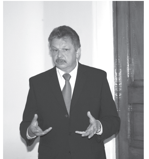
რექტორატებსა და საგარეო დეპარტამენტებს შორის. ორმხრივი ურთიერთობებს გააფართოვებთ უმაღლესი სასწავლებლის ადმინისტრაციის სხვა დეპარტამენტებთანაც.