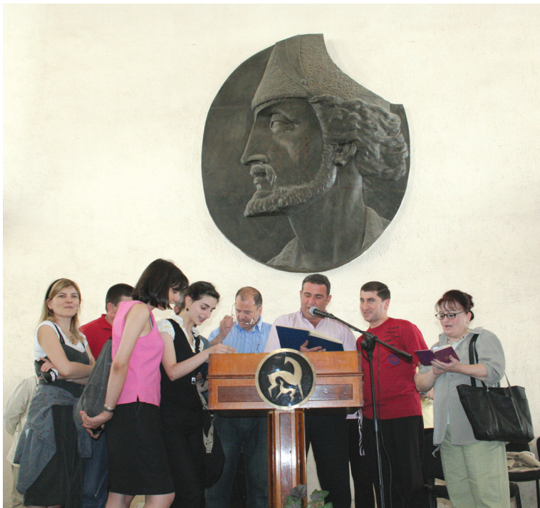
17 ივნისს ივანე ჯავახიშვილის სახელობის თბილისის სახელმწიფო უნივერსიტეტის პირველი კორპუსის ფოიეში უკვდავი პოემის — „ვეფხისტყაოსნის“ წასაკითხად უამრავმა მსურველმა მოიყარა თავი. მათ შორის იყვნენ საზოგადოებისთვის ცნობილი პიროვნებები: მწერლები, პოლიტიკოსები, ლექტორები, ასევე სტუდენტები და საჯარო სკოლის მოსწავლეები.