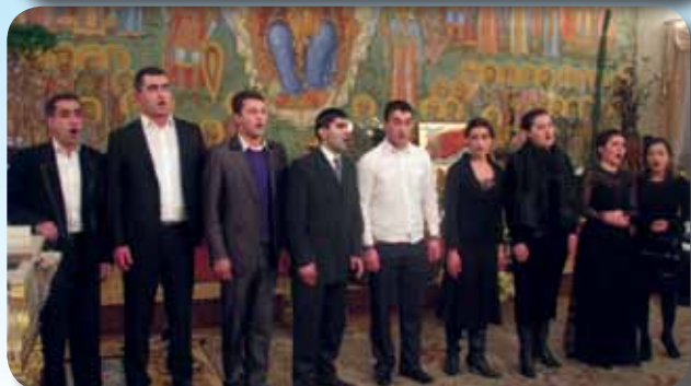
გიულეტენი გამოდის 2007 წლის ივლისიდან