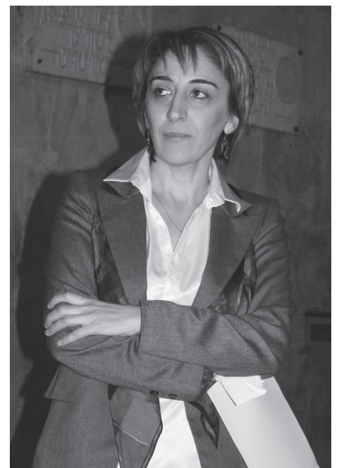
სახელმწიფო ვერ სთავაზობთ. მათ, ასევე, უფასოდ ჩაუტარდება ტრენინგები, სემინარები.

ამჟამად სამშობლოში დაბრუნებული სტუდენტებიცაა, დაახლოებით, სამოცამდე სტუდენტი და რეუგისტრირებული. მაგრამ ეს არ არის ზუსტი ციფრი, რადგან ჩვენ რეკომენდაციას მხოლოდ მაღალკვალიფიცირებულ კადრებს ვუწვევთ. პროგრამის მიზანია, რომ მათ შეეუქმნათ ისეთი პირობები, რასაც ხშირად